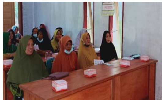
Gambar 2. Sosialisasi Kegiatan Pengabdian Kepada Masyarakat

dendritik. Selain itu, curcumin berperan sebagai anti inflamasi, antioksidan dan immunomodulatory pada tubuh. Sedangkan jahe mengandung senyawa fitokimia yang mampu meningkatkan sistem pertahanan tubuh dengan meningkatkan status antioksidan