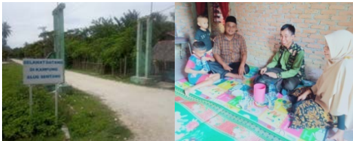
Gambar 1. Survey lokasi kegiatan PKM

kelompok ibu-ibu PKK untuk mengolah tanaman TOGA menjadi minuman kesehatan seperti jamu. Namun pengolahan TOGA mejadi jamu herbal belum berjalan baik sehingga perlu dilakukan penyuluhan untuk memberikan pemahaman kepada masyarakat akan pentingnya jamu herbal untuk meningkatkan sistem imun tubuh dalam upaya penanggulangan dan pencegahan covid-19 di masa pandemi. Selain itu juga diperlukan pengetahuan dan motivasi yang tinggi untuk menumbuhkan keinginan dan minat masyarakat dalam pembuatan jamu herbal. Pelatihan pembuatan jamu herbal ini bertujuan untuk meningkatkan sistem imun dalam upaya penanggulangan dan pencegahan penularan covid-19 di Desa Alue Sentang. Kegiatan ini terdiri dari serangkaian kegiatan tentang pembuatan jamu herbal yang diharapkan dapat memberikan dampak positif bagi kesehatan dan perekonomian masyarakat Desa Alue Sentang.