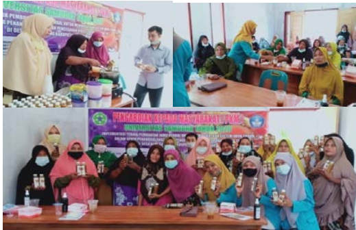
Gambar 3. Pelatihan pembuatan jamu herbal

2020 (Gambar 3). Pelaksanaan kegiatan PKM didahului dengan pemberian buku panduan kegiatan pembuatan jamu herbal kepada peserta kegiatan dengan tujuan untuk mempermudah saat pelatihan kegiatan. Buku panduan tersebut berisi tentang alat-dan bahan yang digunakan serta tata cara pembuatan jamu herbal. Selanjutnya dilakukan kegiatan pemberian materi kegiatan dan praktek lapangan dengan tujuan untuk meningkatkan pengetahuan peserta kegiatan sehingga lebih aplikatif dan interaktif. Untuk mengetahui pencapaian tujuan kegiatan pelaksanaan program pengabdian kepada Ibu PKK dilakukan dilakukan pretest dan posttes di awal dan diakhir kegiatan. Berdasarkan hasil survey tingkat pemahaman ibu PKK sesudah dan sebelum diberikan pelatihan, maka dapat di lihat pada Gambar 4