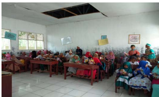
Gambar 1. Kondisi Mitra (Gambaran Siswa kurang Mampu di Desa Sialogo Kabupaten Tapanuli Selatan)

Kemiskinan merupakan masalah multidemensi Sulit mengukurnya sehingga perlu kesepakatan pendekatan pengukuran yang dipakai (Syawie, 2011). Kemiskinan atau kurang mampu sudah menjadi fenomena sepanjang sejarah kemanusiaan. Indonesia sebagai salah satu Negara yang kaya sumber daya alamnya namun tidak terlepas dari persoalan kemiskinan, akibat adanya salah memahami dan mengurus kemiskinan. Konsekuensi-nya telah membuat jutaan siswa-siswa Indonesia tidak bisa mengenyam pendidikan yang berkualitas dan menguatnya arus urbanisasi kekota. Implikasi lebih jauh kemiskinan telah membuat jutaan rakyat tidak dapat memenuhi kebutuhan pangan, sandang. Pemerintah Indonesia secara berkesinambungan terus melaksanakan berbagai program untuk meningkatkan kesejahteraan rakyat melalui serangkaian penanganan permasalahan fakir miskin dalam rangka memberdayakan keluarga miskin, karena fakir miskin dan anak terlantar harus dipelihara oleh Negara (UUD. RI 1945 pasal 34). Di bawah ini merupakan gambaran siswa kurang mampu yang ada di Desa Sialogo Kabupaten Tapanuli Selatan.