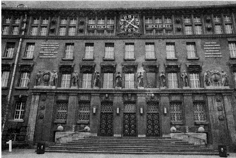
図1 ドイツ図書館(ライプツヒヒ: “本の町”ともいわれている)正面玄関