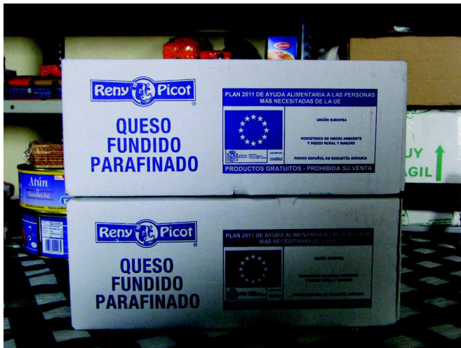
Aliments al local de Càritas, procedents dels excedents alimentaris de la Unió Europea

En segon lloc el fenomen de la immigració: en els darrers deu anys, abans de l'arribada d'aquesta crisi tan profunda, la vinguda d'immigrants a Catalunya va fer augmentar la població en més d'un milió de persones. Era una època on la feina, sobretot en l'àmbit de la construcció i serveis, abundava, i era necessària molta mà d'obra. Hi havia feina per a tothom.