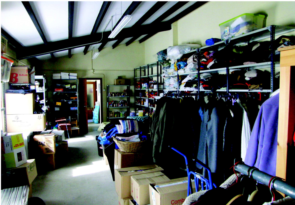
Interior del rober i banc d'aliments de Càritas Parroquial de Tona

L'any 1993 el municipi de Tona es va adherir a la Mancomunitat Intermunicipal voluntària La Plana. Un dels serveis que l'Ajuntament de Tona li va diferir, tot i que s'ofereix des de les instal·lacions municipals, és el de Serveis Socials i Ciutadania que inclou, entre d'altres, serveis socials bàsics, atenció a les dones, serveis d'acollida i immigració, atenció domiciliària i convivència. Pel que fa als serveis socials, i abans d'analitzar les característiques i situació actual de Tona, cal tenir en compte que el sistema de serveis socials ha viscut en la darrera dècada uns canvis molt importants. Per una banda els canvis demogràfics i socioeconòmics: la població de Catalunya ha sofert un envelliment progressiu durant els darrers anys, amb especial incidència en les persones majors de 84 anys.