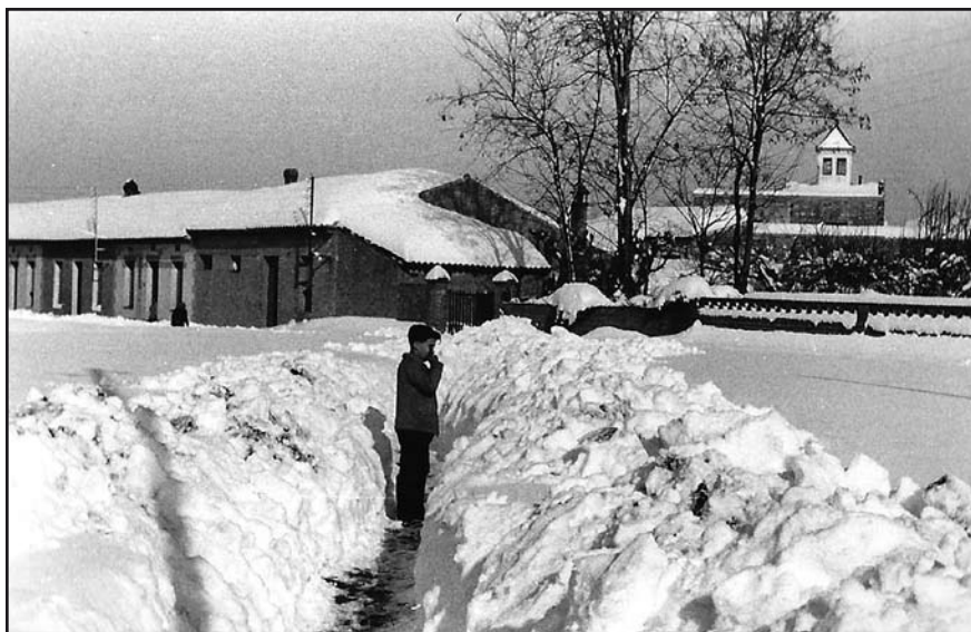
Plaça Esbert i les primeres cases del carrer Perpetuo Socorro, al barri de Can Calet.

Com que la vida quotidiana no s'atura, es va donar la circumstància que va morir un home a la zona de Can Calet, concretament al carrer Sant Jeroni; a l'estar tot incomunicat no hi havia forma d'enterrar el difunt. Primer amb caire voluntari i després organitzat per l'Ajuntament, es varen preparar unes brigades per anar obrint camí: era d'una amplada d'uns dos metres per tota la carretera, passant també per l'església i fins al cementiri. Moltes empreses cedien un dia del jornal dels seus treballadors per anar treient neu, però també se n'hi afegien més esporàdicament.