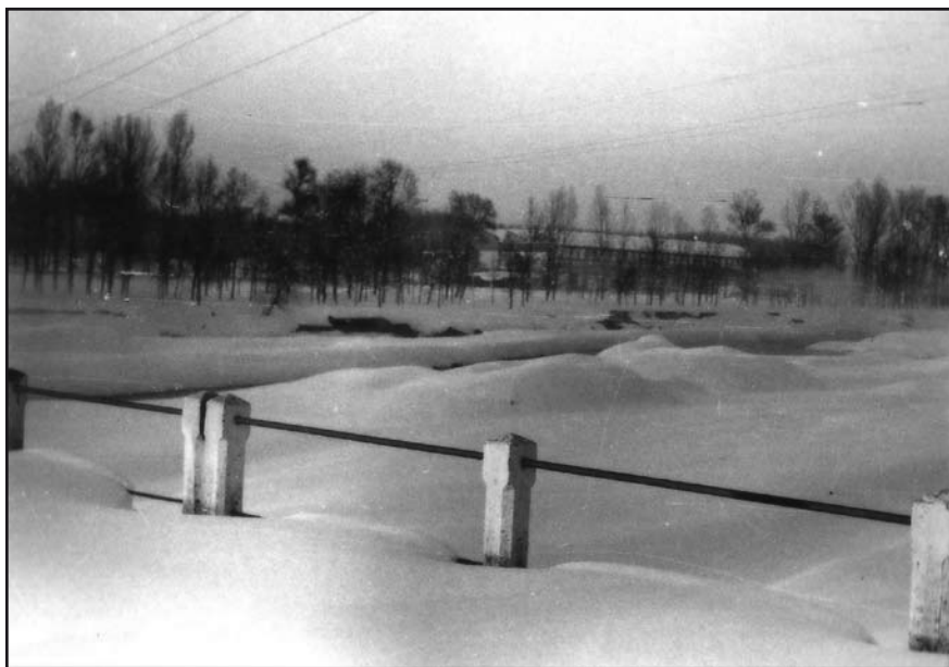
La neu sobre el pont del riu Besòs; es veu la barana de l'antic pont construït als anys 20. Entre els arbres es veu l'empresa Fredenhagen Ibèrica. Aquest pont fou substituït l'any 1969.