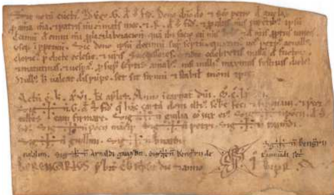
Pergamí de Savallà del Comtat, 1173.