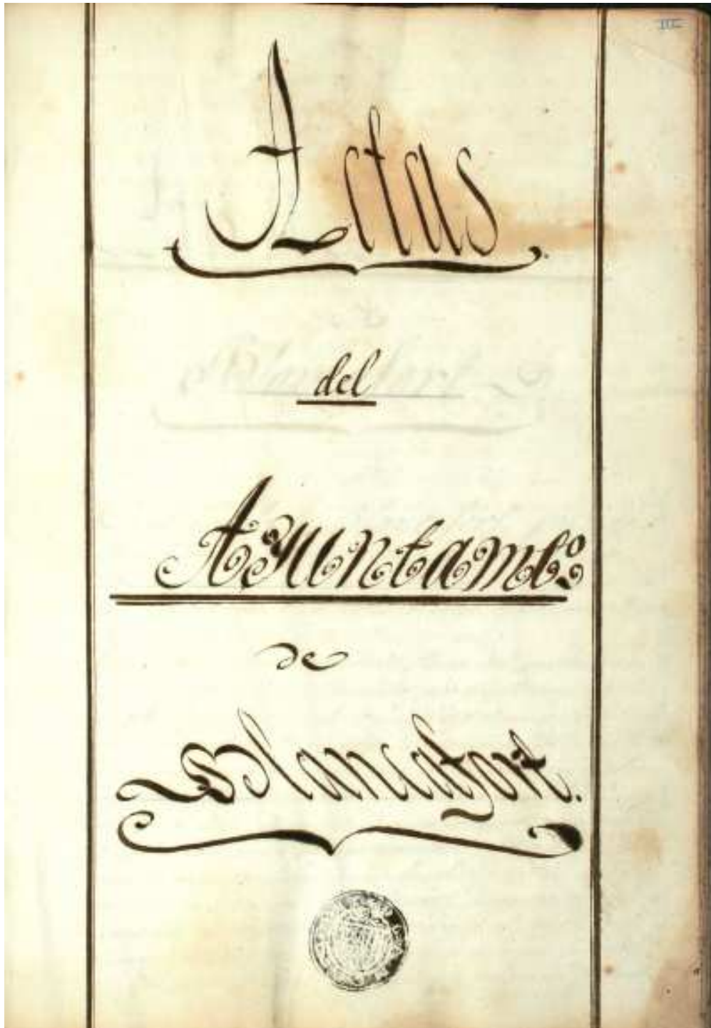
Llibre d'Actes de l'Ajuntament de Blancafort, 1829-1867.

En conclusió, mercès a la introducció de les noves tecnologies l'Arxiu Comarcal de la Conca de Barberà ha esdevingut un proveïdor d'un servei del qual, sens dubte, se'n podran beneficiar les respectives administracions locals i comarcal, els estudiosos i investigadors, i també el públic en general, ja que gràcies a la digitalització el món es converteix en la nova sala de consulta d'aquest centre comarcal d'arxius.