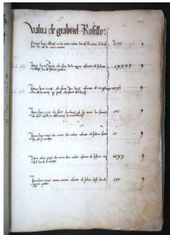
Llibre de vàlues, fragment, Rocafort de Queralt (s. XV).