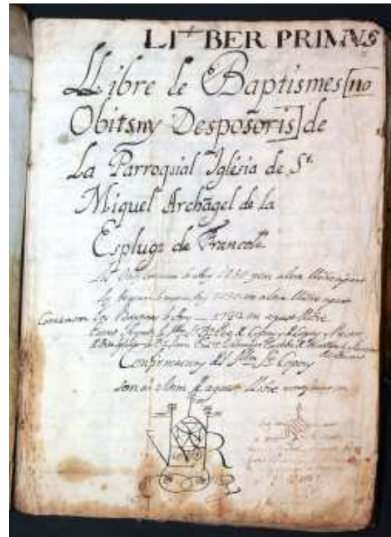
Llibre de baptismes de la parròquia de l'Esplugu de Francolí, 1732-1770.