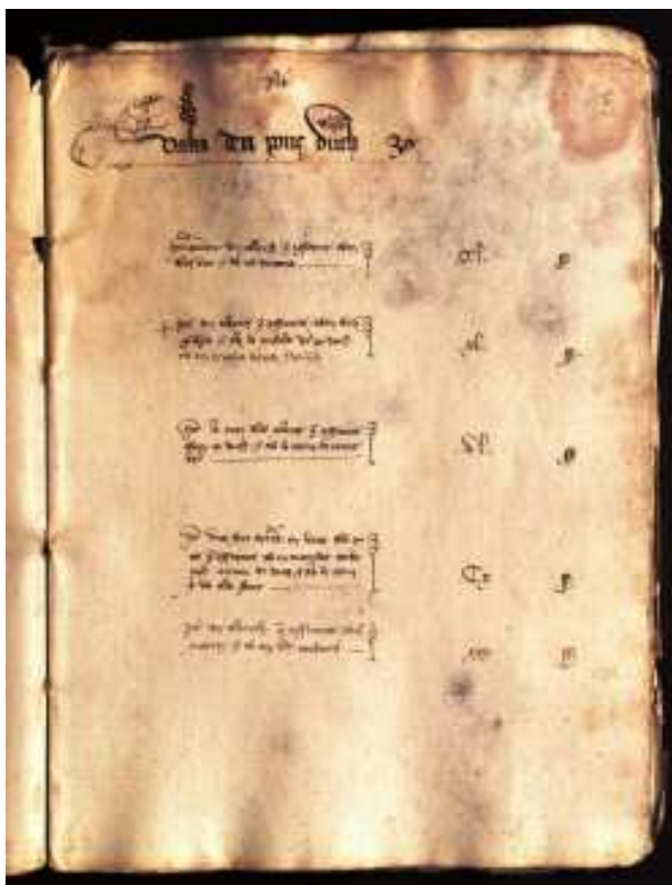
Llibre de vàlues de Vimbodí, 1506.