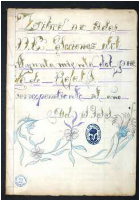
Llibre d'Actes de l'Ajuntament de Rojals, de 1911.