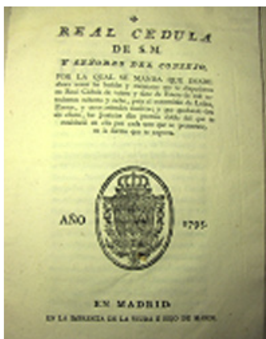
Cèdula Reial del 1795 suprimint les batudes per improductives, però doblant els preus de les recompenses a qui hagués matat llops i d'altres animals considerats perniciosos.

Així, els arrogants Homo sapiens vam voler-nos separar de la nostra condició biològica, com la de qualsevol ésser viu, i no es va tardar gaire d'anar contra molts animals. Gairebé arreu s'adoptava una posició coincident per tal de fer extingir aquells que consideressin perjudicials o simplement antipàtics. De vegades per pura ignorància del paper tan valuós que fan els depredadors als ecosistemes. Els que gosaven plantar-nos cara, menjar-se el nostre bestiar i interferir-nos el camí, ja feien nosa. A aquesta visió antropocèntrica i superba hi havien contribuït les diverses religions, que una rera l'altra anaven considerant determinades espècies com éssers malignes, impurs o encarnats no pas per Déu, sinó per les forces infernals.