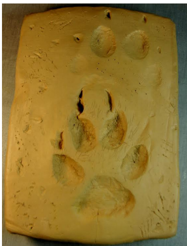
Petjada de llop obtinguda a la Sierra de la Culebra (Zamora, Espanya) on hi ha poblacions importants de llops, El turisme que hi acudeix per observar-los ha esdevingut un recurs molt destacat per a les economies dels seus habitants.

La vinguda del llop italofrancès va agafar molts investigadors desprevinguts. Davant del mapa peninsular, només podien imaginar-se un possible escenari mirant cap a l'esquerra, atents a l'expansió del llop ibèric. Malgrat l'expectativa, no ha arribat i sembla que pot anar més lent, si bé es preveu força inexorable i estem prou convençuts que no tardarà massa