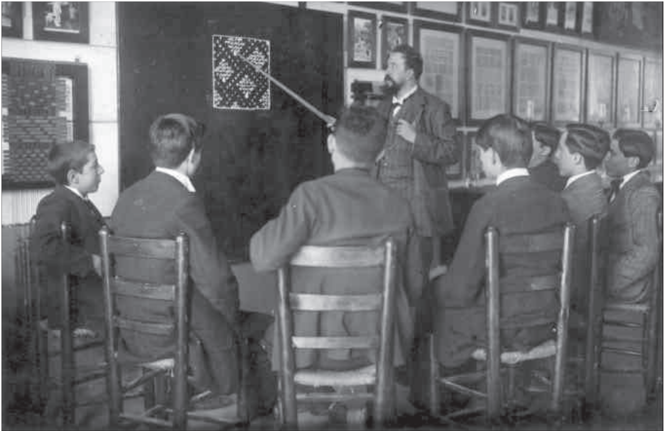
Classes de lligotècnia davant d'un lligament sobre quadrícula. Museu de Badalona. Arxiu Josep M. Cuyàs. Fotògraf: Sayol

Crònica amb majúscula de la indústria tèxtil fins a l'esclat de la Guerra Civil l'any 1936), Pau Rodon crea un espai en el qual tothom pot intercanviar opinions i informació, tant a nivell nacional com internacional.