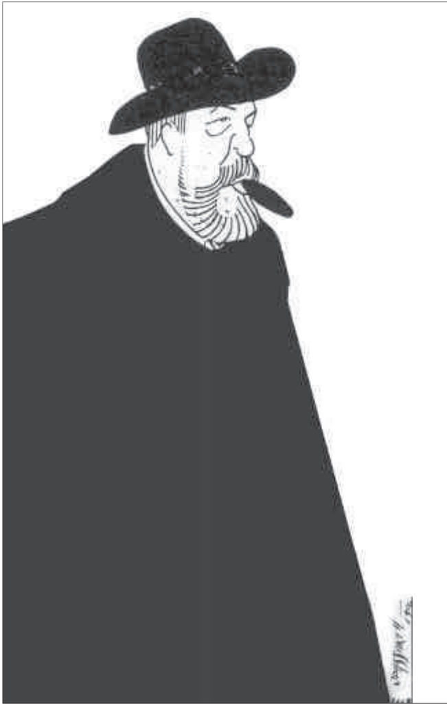
Pau Rodon, 1911. Caricatura original de Jaume Passarell. Tinta i aquarel·la sobre paper, 32,5 x 18,5 cm. Museu de Badalona, inv. 2663.

teoria de teixits s'estudiaven de forma molt superficial els teixits d'una certa dificultat tècnica considerats com a especials.