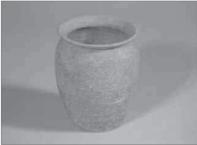
Dipòsit 1.

natural. La nova edificació va aprofitar com a mur de tancament nord, el mur d'aterrament del decumanus maximus . L'interior estava compartimentat en diversos àmbits d'amplada força regular. Dues de les tres habitacions més properes al decumanus tenien paviments d' opus signinum i parets enlluïdes. L'àmbit contigu estava pavimentat també amb opus signinum , amb un motiu central format per incrustacions de pedra calcària de diferents colors que dibuixaven un cercle al voltant d'una placa quadrada del mateix material. Aquesta part es degué utilitzar com a habitatge. Les altres habitacions tenien el sòl de terra premsada, i en una d'elles es conservaven empremtes de gerres, la qual cosa potser indicaria que aquesta zona hauria tingut una funció de magatzem. 1