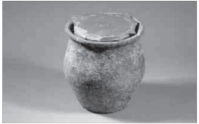
Dipòsit 4.

L'edifici B encara està en fase d'excavació, i per tant, se'n desconeixen en bona part els nivells inicials. A l'igual que l'edifici A, també aprofitava com a mur de tancament nord, el mur d'aterrossament del decumanus maximus , i l'interior estava compartimentat en diversos àmbits d'amplada força regular. L'evolució cronològica és similar a la de l'edifici A, ja que s'hi ha localitzat una seqüència estratigràfica des del segle VI, el moment més tardà, fins a finals del segle I dC, és a dir, l'època flàvia, que és la fase en què està actualment la intervenció arqueo-