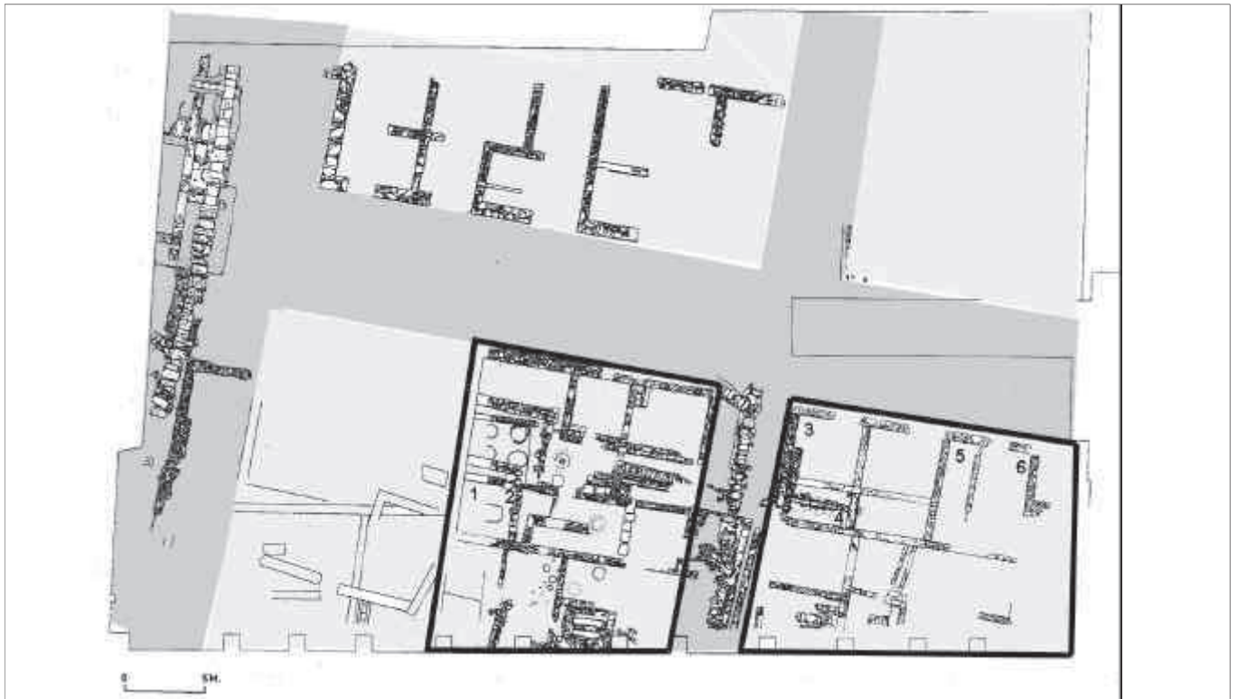
Subsòl de la plaça de Font i Cussó. Trama fosca: carrers; trama clara: edificacions. Amb traç gruixut estan marcats els edificis A i B. Dibuix: Antoni Fonollà.

En dos d'aquests edificis, anomenats a partir d'ara edificis A i B, situats al sud del decumanus maximus i separats entre ells pel cardo minor , es varen documentar sis gerres ceràmiques enterrades en el sòl, que contenien diverses restes orgàniques, i que per les seves característiques, es van relacionar amb ofrenes de tipus ritual.