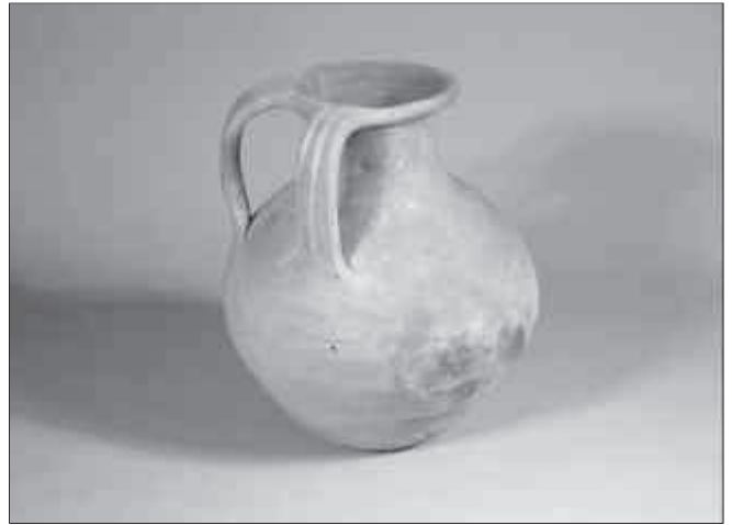
Dipòsit 2.

La diferència de cotes existent entre el nivell d'utilització de l'edifici A i el decumanus maximus , és tan considerable que faria impossible l'accés des d'aquest carrer, i, per tant, s'hi