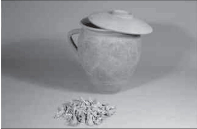
Dipòsit 5.

dres i carbons a l'interior. Estava coberta amb una tapadora feta amb el fons d'un plat de ceràmica sigillata itàlica que tenia una marca en el fons intern amb el nom del taller ATEI MAHETIS , un terrisser d'Arezzo que fabricava les seves produccions ceràmiques a finals del segle I aC. El plat estava tallat per poder ser utilitzat com a tapadora, a la mida exacta de la vora de l'olleta que havia de tapar. Aquest dipòsit estava cobert per un nivell de terra que contenia materials datables a mitjan segle I dC.