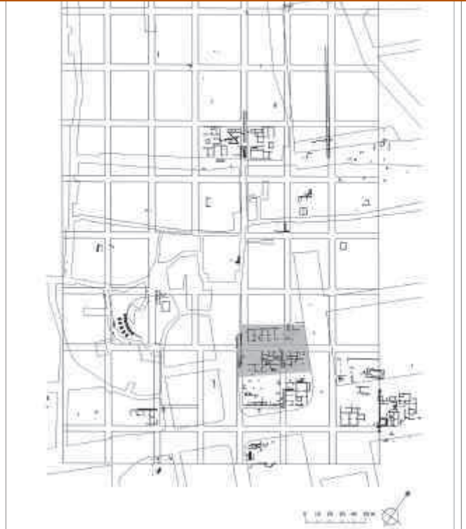
Planta de la ciutat romana de Baetulo . Trama del jaciment Font i Cussó. Dibuix: Antoni Fonollà.

Aquest tipus d'ofrenes rituals també s'ha documentat a la ciutat romana de Baetulo , i més concretament, en les intervencions arqueològiques que en aquests darrers anys s'han portat a terme en el subsòl de la plaça de Font i Cussó. En aquesta zona, els treballs realitzats han posat al descobert un sector de Baetulo que va ser planificat ja en el moment fundacional de la ciutat (inici del segle I aC). La seva urbanització va comportar l'obertura de tres carrers, el decumanus maximus , el cardo maximus i un cardo minor , que delimitaven quatre insulae , excavades en part, en les quals s'han documentat diversos edificis, que malgrat no tenir tots la mateixa cronologia inicial, van donar lloc a un conjunt coherent tan constructivament com funcionalment. Aquest conjunt va anar evolucionant i transformant-se al llarg del temps, fins al punt que en alguns sectors s'ha arribat a documentar una seqüència de 600 anys de vida continuada.