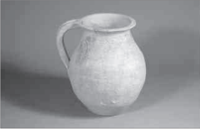
Dipòsit 3.

Dipòsit 2: es va trobar al costat del dipòsit 1, també tallant el sòl natural. En aquest cas es tracta d'una gerra de ceràmica comuna amb dues nanses col·locades una al costat de l'altra, sense que es pogués determinar què contenia a l'interior. La gerra estava coberta pel mateix nivell que en l'anterior dipòsit, sense cronologia precisa.