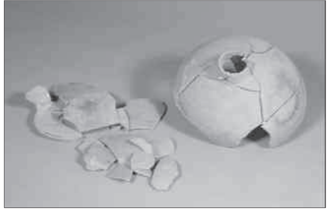
Dipòsit 6.

Dipòsit 5: a l'angle nord-oest d'una de les habitacions de l'edifici, i tallant uns nivells de mitjan segle I dC, va aparèixer una altra ofrena. En aquest cas es tracta d'una gerra de ceràmica comuna decorada amb estries verticals a la panxa i amb una nansa petita. Possiblement es tracta de la forma Mayet XXV, característica de la ceràmica de parets fines, tot i que les dimensions de la gerra ens inclinen a considerar-la com una ceràmica d'ús comú. L'interior contenia abundants res-