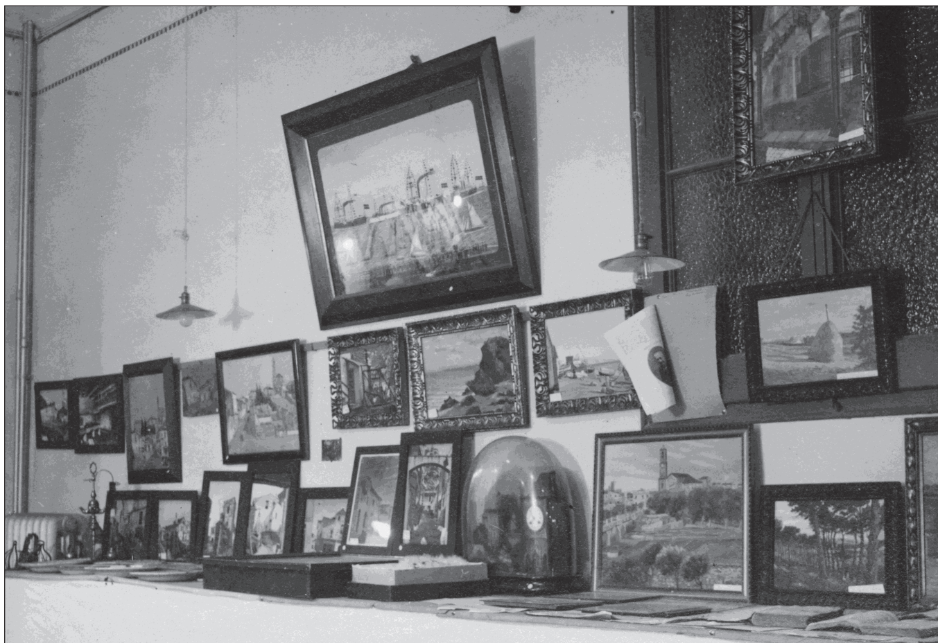
Exposició temporal sobre Badalona retrospectiva, 1931. Museu de Badalona. Arxiu Josep M. Cuyàs Tolosa

Al cap d'un any just esclatà la Guerra Civil del 1936, i la incorporació dels socis al front deixà l'Entitat i el Museu en mans dels més joves, que tingueren cura de tot fins que la