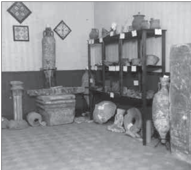
Museu de l'Agrupació Excursionista al carrer de Lleó, agost de 1931. Museu de Badalona. Arxiu Josep M. Cuyàs Tolosa

La continuïtat del Museu només podia quedar avalada per un ens municipal constituït en forma de patronat permanent, on les forces vives més representatives de la ciutat es comprometessin públicament a donar suport estable a l'Entitat. El 18 de juliol del 1935, a les 10 del vespre a l'Ajuntament, quedà constituït el patronat següent: