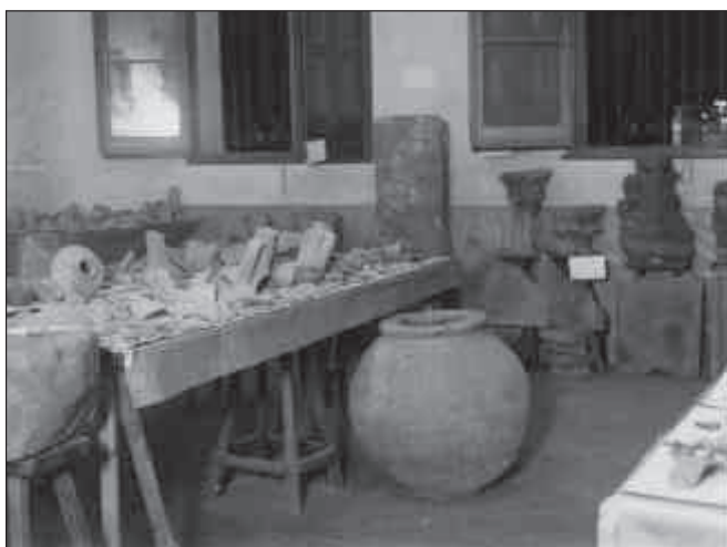
Exposició de peces procedents d'excavacions al Museu de l'Agrupació Excursionista, desembre de 1931. Museu de Badalona.