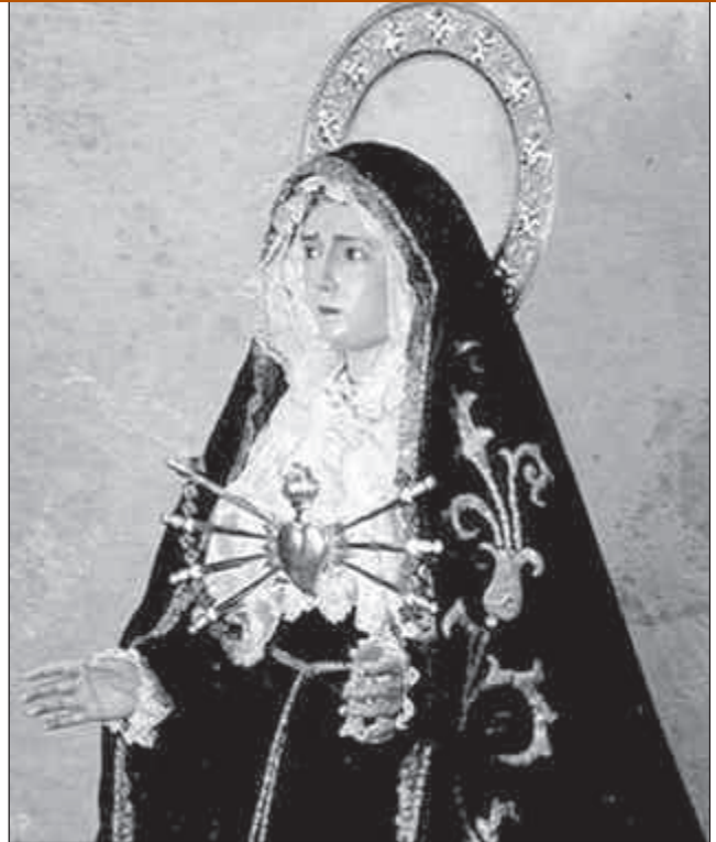
Imatge de la Mare de Déu dels Dolors.