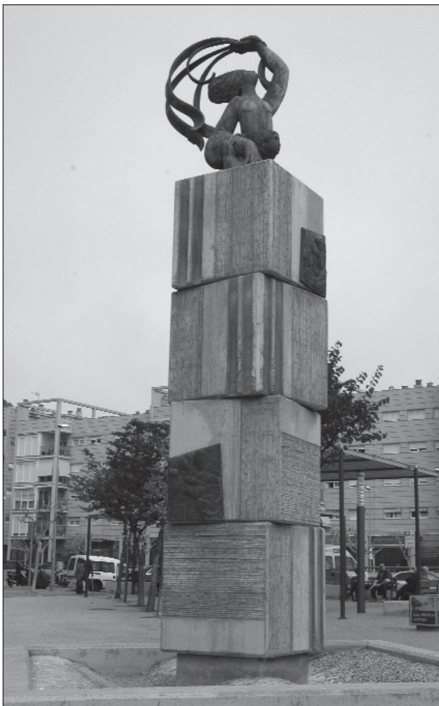
Mediterrània , escultura d'Àlvar situada a Montgat.

Fa quatre anys, la Universitat va finançar la producció d'un documental sobre Àlvar, titulat Àlvar: su Visión y su Arte . Aquest documental va guanyar un primer premi en un festival per a pel·lícules independents i s'ha presentat a la televisió pública.