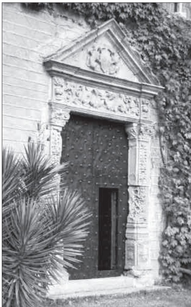
Porta d'entrada a la Torre Pallaresa, d'estil renaixentista, amb les armes de la família Cardona.