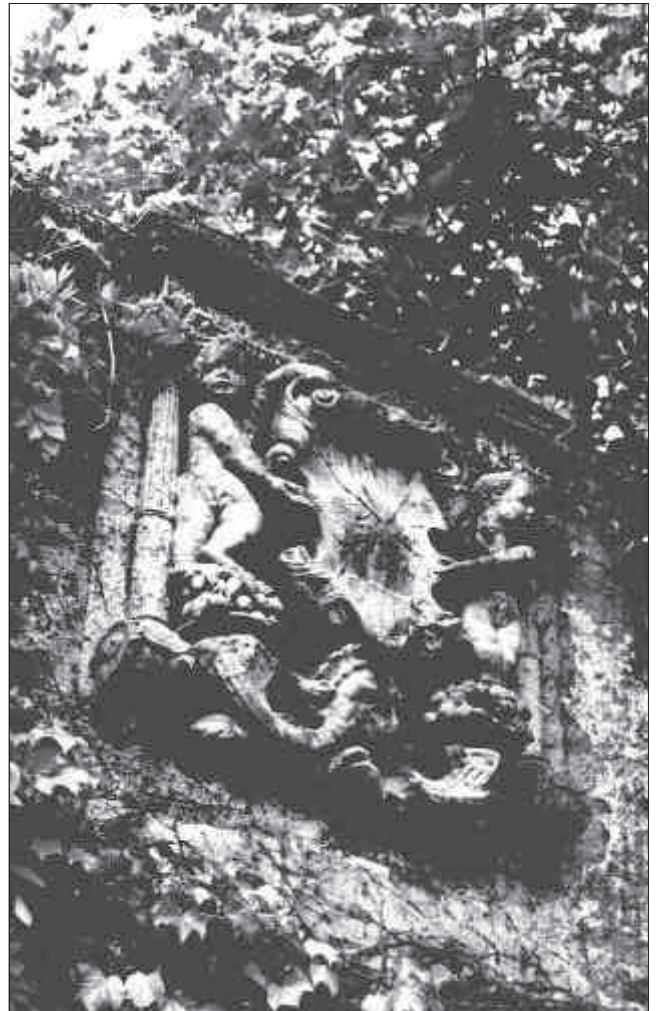
Escut d'armes de la família Cardona, situat a la porta d'entrada de la Torre Pallaresa.