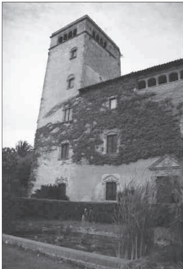
La Torre Pallaresa al segle XVI pertanyia al bisbe Joan de Cardona, de la família dels Cardona i enteparent d'Enric d'Aragó, sisè duc de Cardona i lloctinent general de Catalunya, que féu complir l'interrogatori per conèixer els francesos que vivien als ports i llocs marí-tims del Principat.

Per poder valorar la incidència total en el temps de la immigració francesa a Badalona - si es té en compte que aquest interrogatori només comptabilitza els francesos residents el dia que es fa - faltarien les persones arribades a Badalona que