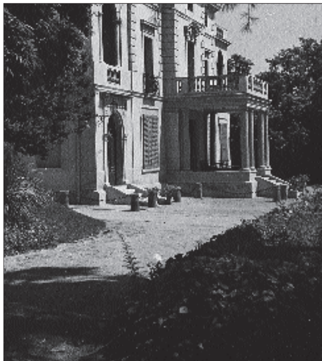
Torre Arnús, 1952 (Fotògraf Josep Cortinas. Museu de Badalona. Arxiu Josep M. Cuyàs).

En incrementar-se l'extensió i el valor de les finques, la posició que la família Arnús ocupava com a gran contribuent en aquest terme municipal òbviament anà millorant gradualment. Per això el seu nét Gonçal, el 1920, ocupava la desena posició per la contribució que pagava.