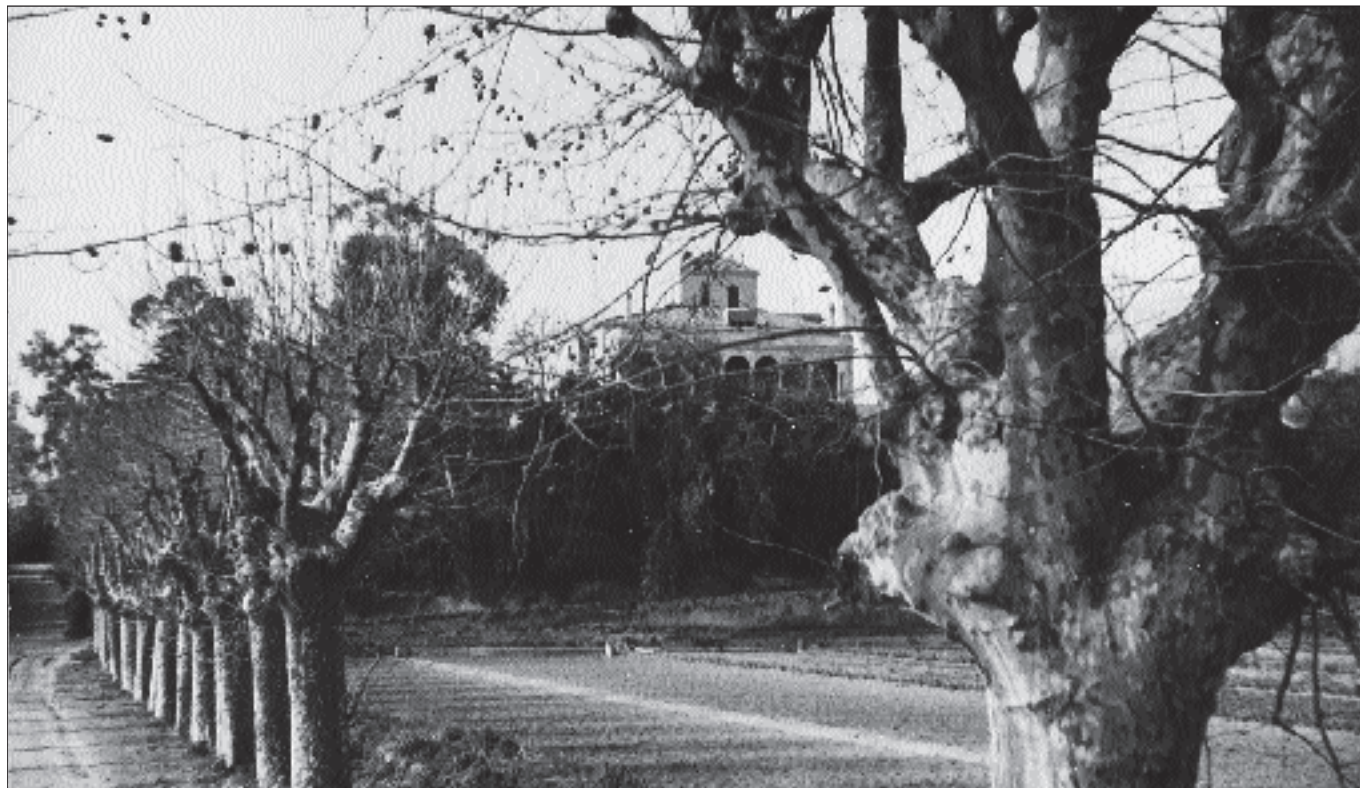
Panoràmica de la torre Arnús, des del barri de la riera Canyadó, 1952.