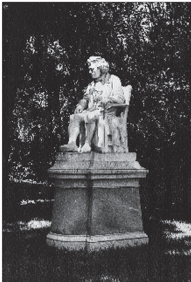
Estàtua de Beethoven al jardí de la torre Arnús, [195?] (Fotògraf: Josep Cortinas. Museu de Badalona. Arxiu Josep M. Cuyàs).

"Evaristo Arnús, 1820-1890. Semblanza y apuntes biográficos de un badalonés ilustre". A Revista de Badalona , núm. 204, 1945.