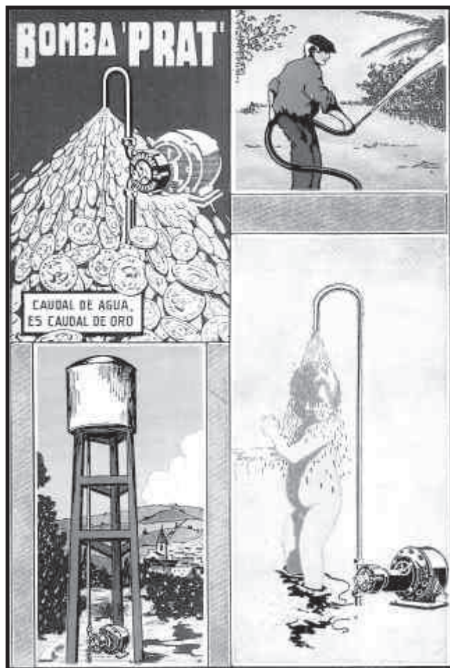
5. Cartell de Bomba Prat

Segons el sistema laboral del franquisme, quan el treballador es posava malalt, no cobrava la integritat del sou. Li restaven el 20 o el 25 %. El que el treballador tenia declarat que guanyava era inferior al que guanyava realment. En conseqüència, quan es posava malalt, guanyava menys del que guanyava. La Bomba Prat, però, tenia una mena d'associació, dipositària dels diners que setmanalment o mensualment hi anaven posant els mateixos treballadors, que els permetia de cobrar la integritat del sou quan emmalaltien. Però aquest ajut compensatori era particular de la Bomba Prat, mentre que a la majoria d'empreses això no passava. Aquest tipus d'associacions i d'ajuts interns solament eren possibles perquè hi havia acord entre els treballadors i l'empresari, dins d'un marc social, a l'interior de l'empresa, de concòrdia i bon enteniment. Aquest acord, evidentment, estava fora del règim habitual de la política social franquista i anava més enllà de la paperassa i la burocràcia que molt sovint tot ho emmerda.