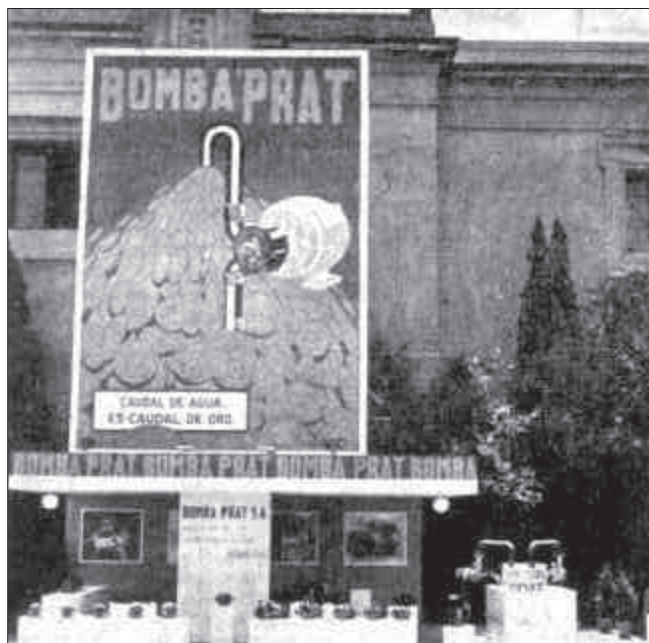
3. Fira de mostres de Barcelona ( Revista de Badalona 19 de juny de 1943.).

L'empresa va tancar a finals dels setanta, entre el 1978 i el 1979. El clima no era gens favorable a la concòrdia laboral, ja que ens situem en un context polític i social molt conflictiu, el de la transició política: cau el règim franquista, Arias Navarro desapareix d'escena, Adolfo Suárez forma govern amb la UCD, i se signen els pactes de la Moncloa, de funesta memòria per al sindicalisme català, ja que donen un enorme poder als grans sindicats majoritaris com CCOO i UGT, de clara vocació estatal. En aquests pactes els dos macrosindicats (UGT i CCOO), talment dues multinacionals, es reparteixen les quotes de representació estatal. El