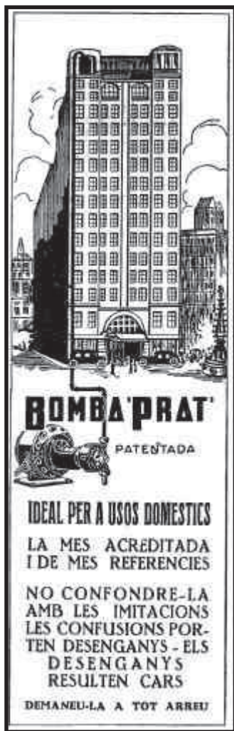
2. Anunci de la Bomba Prat aparegut en diverses dates en El Eco de Badalona de l'any 1929.

vegades, i el que en principi es creia que havia de ser un cost d'instal·lació en un nou local va resultar que n'era un altre. A més, l'empresa sí que va produir un gran nombre de bombes, però no les va poder vendre, fins al punt que va emmagatzemar un gran estoc d'unitats (en canvi, avui dia les empreses no tenen estocs). Diguem-ne que hi havia una saturació del mercat.