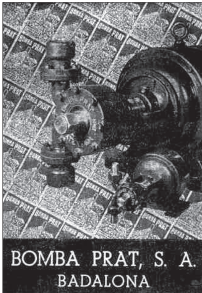
4. Anunci aparegut el dia 24 de desembre de 1941 en Revista de Badalona .

Els treballadors van quedar satisfets de la bona pensada dels amos i els van fer un homenatge: van dir que un dissabte al matí no s'hauria de treballar. Els treballadors van reunir els amos i els van fer una celebració amb vermut, amb rams de flors per a les senyores, regals... I els amos, emocionats, van dir: «doncs mireu, cada any per aquesta data us portarem a