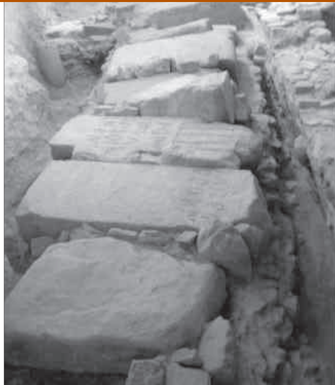
1. Claveguera del cardo maximus a les excavacions de la plaça de Font i Cussó.

L'esmentada campanya arqueològica portada a terme el passat mes de juliol es va centrar en l'excavació d'una gran claveguera romana que anava per sota d'un important carrer prop del fòrum de la ciutat, l'anomenat cardo maximus , que estava orientat en direcció NO/SE (fig. 1). La datació de la claveguera és, per ara, indeterminada, ja que l'excavació no està encara acabada, no s'ha arribat als nivells relacionats amb el seu moment inicial i per tant es desconeix la data de la seva construcció. Es va posar al descobert un tram de 13,5 m d'aquest col·lector i es comprovà que feia 0,80 m d'amplada per 0,90 m de profunditat i que els seus murs estan construïts segons la tècnica de l' opus caementicium . La base d'aquesta claveguera està formada per lloses rectangulars de pedra posades de forma esglaonada per tal de salvar el fort pendent que presenta el carrer, un 29,5% de desnivell. La claveguera estava coberta per grans blocs de pedra en forma de lloses, alguns molt ben escairats.