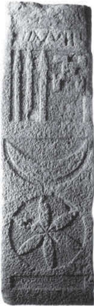
5. Estela funerària ibèrica de can Peixau, decorada i amb una inscripció en lletres ibèriques.

un canvi en la formulació onomàstica ibèrica entre una i altra inscripció. És a dir, mentre en una inscripció, la del pare, aquest s'identifica simplement amb un nom únic, en la segona, trobem també el nom del difunt, el fill, però amb indicació específica de la seva filiació. Tot i que els epígrafs funeraris ibèrics indiquen ja una primera relació entre el món indígena i el romà, aquesta manera d'utilitzar les fórmules posant la filiació del difunt, indica que el personatge del fill mor en un moment en què els gustos i costums romans estan ja plenament assimilats per part dels ibers els quals, en aquests moments, els copien literalment en les seves làpides.