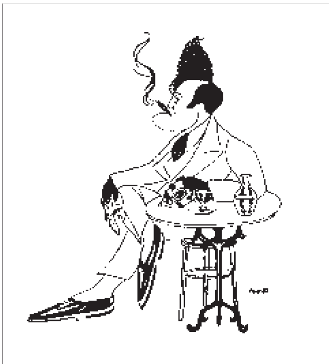
Caricatura de Josep Queralt Clapés realitzada per Joaquim Bruguera i publicada a la revista Pum-Baf! , el 28 d'agost de 1926.