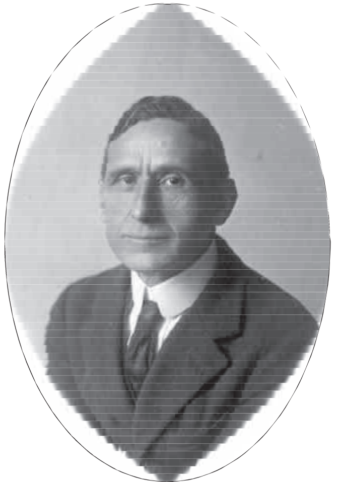
Pompeu Fabra en una imatge dels anys vint. Museu de Badalona. Arxiu J.M. Cuyàs Tolosa.