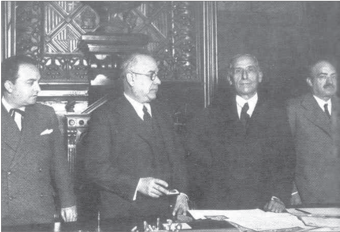
El mestre Pompeu Fabra al Saló de Sessions de l'Ajuntament de Badalona el dia 28 de gener de 1934, en què fou nomenat fill adoptiu i va rebre la Medalla d'Or de la Ciutat. A l'esquerra, Ventura Gassol, conseller de Cultura de la Generalitat, i Josep Casas Costa, alcalde de Badalona. A la dreta del mestre, Jaume Serra Hünter, rector de la Universitat Autònoma de Barcelona.

a la seva instrucció. El jutge instructor inclou, amb el resum de les proves, els comentaris següents: «Del resultado de las presentes actuaciones, el juez considera al inculcado [Pompeu Fabra] incurso en los aparta-