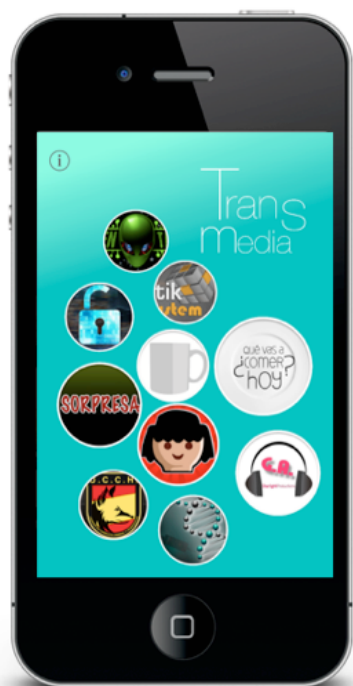
Gráfico 4: Aplicación Transmedia