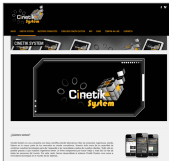
Gráfico 1: Página web del proyecto Cinetik System.

Los estudiantes encontraron a una audiencia prosumidora que participó de las propuestas activas que su narración planteaba. La participación activa de su audiencia era imprescindible para que el seguimiento del producto audiovisual se consumara.