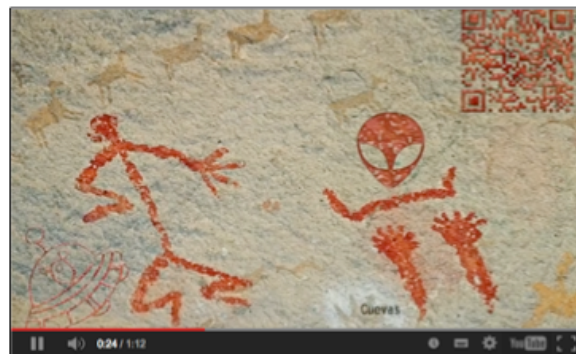
Gráfico 5: Video con código QR en proyecto Alien Talkie

web, evitando así perder a una audiencia que no participaría a través del espacio físico del código.