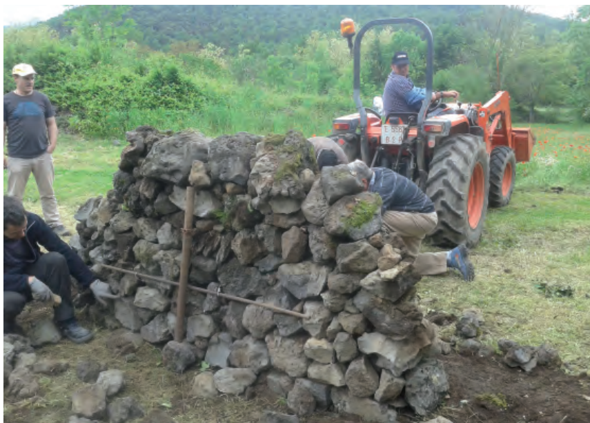
Paret de dos paraments abans de l'assaig destructiu (C. Blasco)