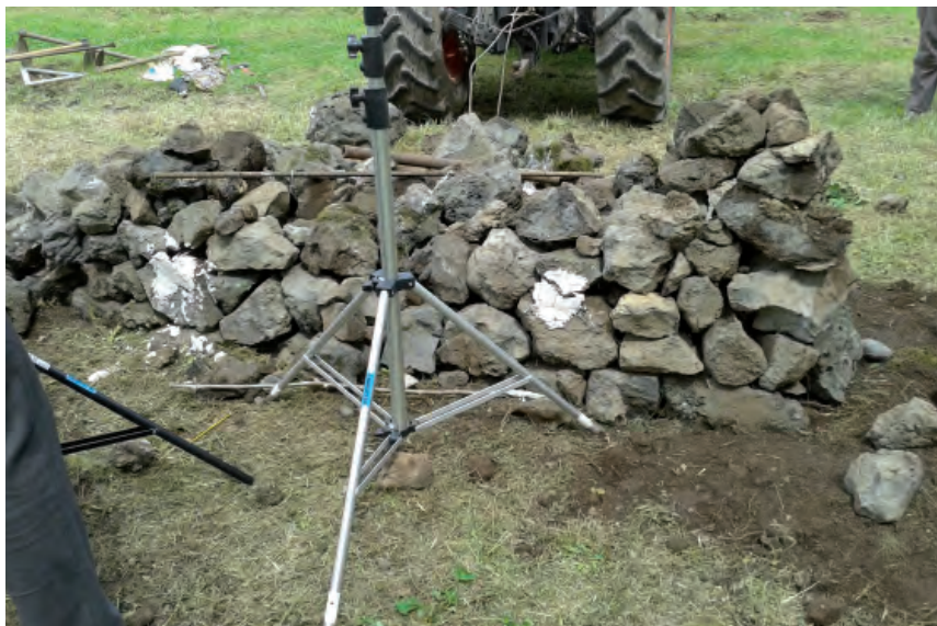
Paret de dos paraments després de l'assaig destructiu (C. Blasco)