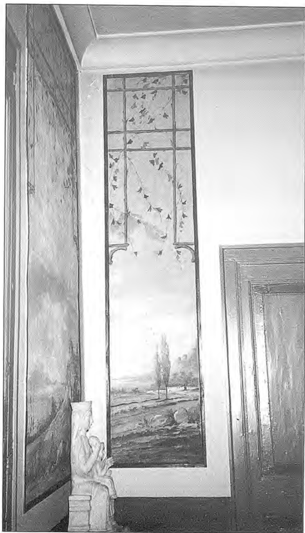
Fig. 12. Pintura al tremp de cola de conill sobre paret, de 188 x 41'5 cm.

( Francesc Estorch, un artesà mestre de l'Escola de Dibuix )