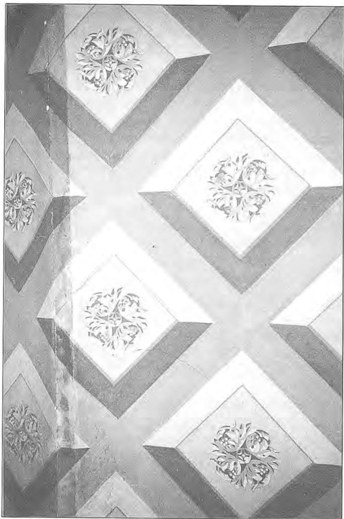
Fig. 3 Decoració d'un sostre amb trepa al tremp de cola de conill que imita uns cassetons.

( Francesc Estorch, un artesà mestre de l'Escola de Dibuix )