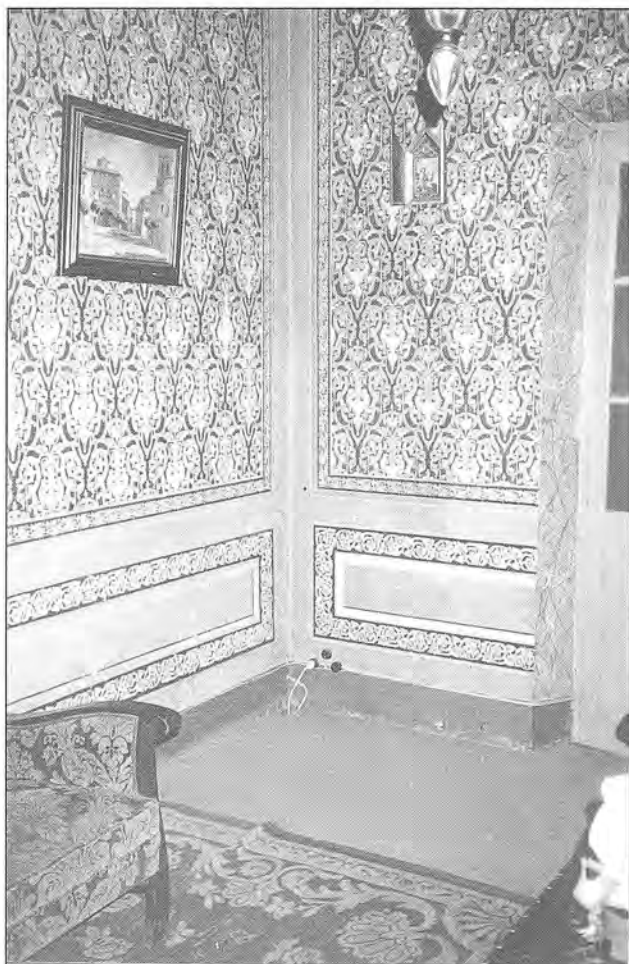
Fig. 2. Interior d'una habitació decorada al tremp de cola de conill amb un dibuix amb trepa molt complex i uns acabats molt ben aconseguits. Els elements ornamentals que apareixen es van repetint de forma igual en totes les parets a partir d'una certa alçada i sense arribar ni al sostre ni tampoc a l'angle de la paret. Tanquen aquesta decoració una sanefa vegetal i uns marcs de diferents colors.