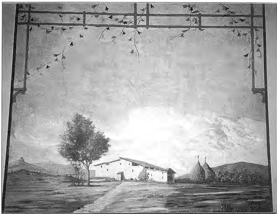
Fig. 6 Pintura al tremp de cola de conill sobre paret de 188 x 192 cm.