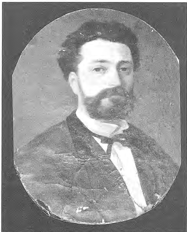
Fig. 1. "Autoretrat", oli sobre una tela ovalada de 50 x 40'5 cm. MCGO.