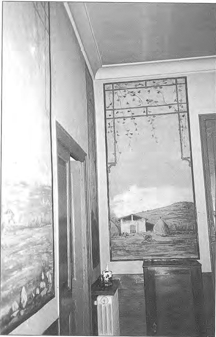
Fig. 10. Pintura al tremp de cola de conill sobre paret, de 188 x 87 cm.