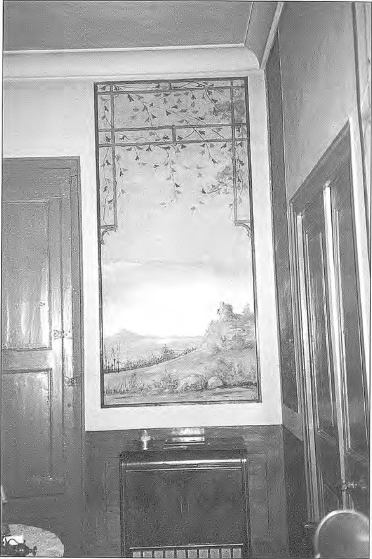
Fig. 9. Pintura al tremp de cola de conill sobre paret, de 188 x 87'6 cm.