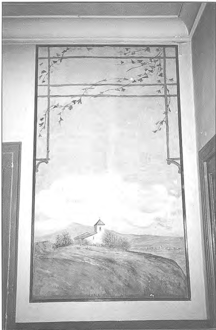
Fig. 7 Pintura al tremp de cola de conill sobre paret, de 188 x 105'5 cm.