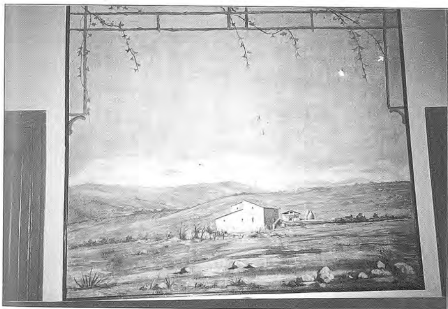
Fig. 5. Pintura al tremp de cola de conill sobre paret, de 188 x 192 cm.

( Francesc Estorch, un artesà mestre de l'Escola de Dibuix )