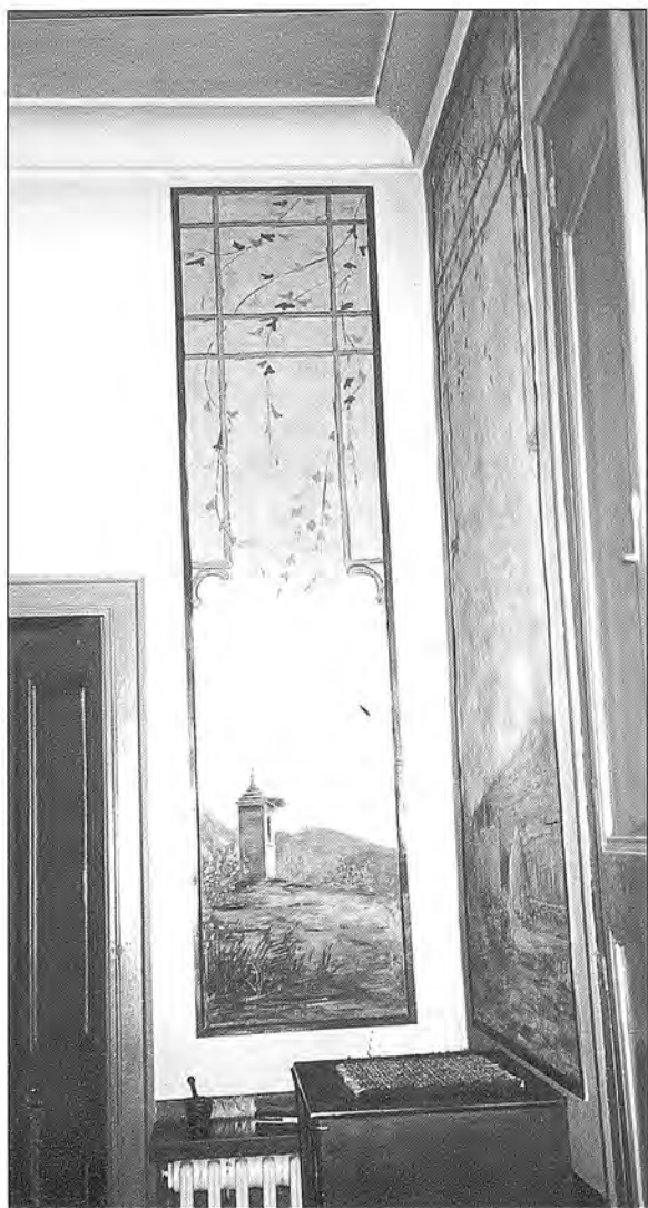
Fig. 11. Pintura al tremp de cola de conill sobre paret, de 188 x 44 cm.