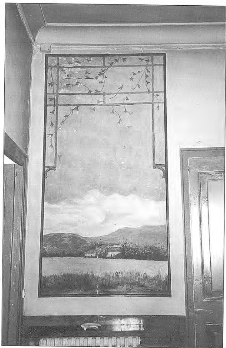
Fig. 8 Pintura al tremp de cola de conill sobre paret, de 188 x 93 cm.

( Francesc Estorch, un artesà mestre de l'Escola de Dibuix )