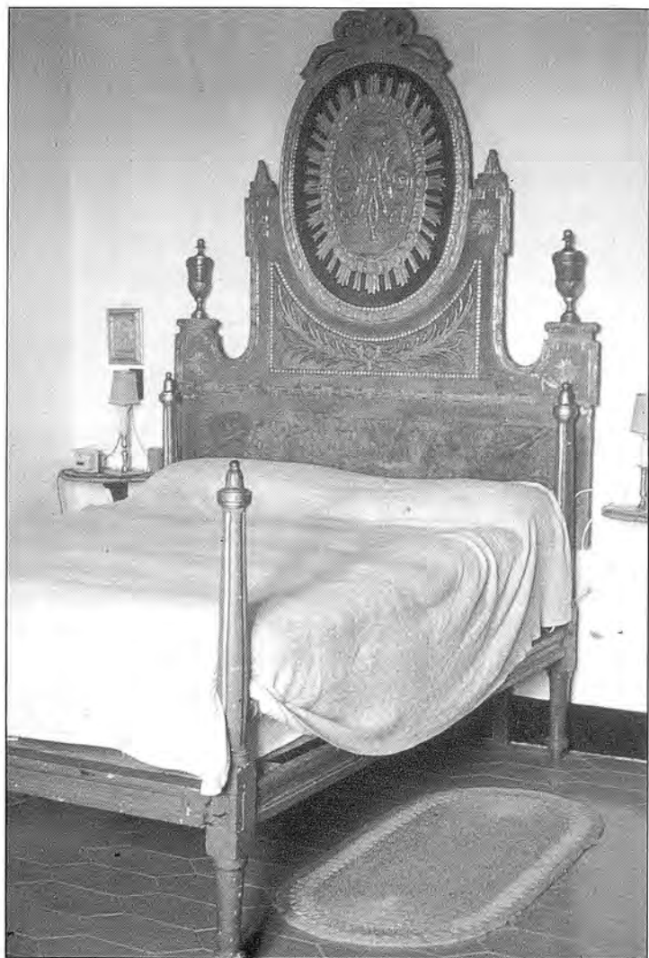
Llit d'Olot seguint les formes Directori i Consolat. Col·lecció Fontcuberta.