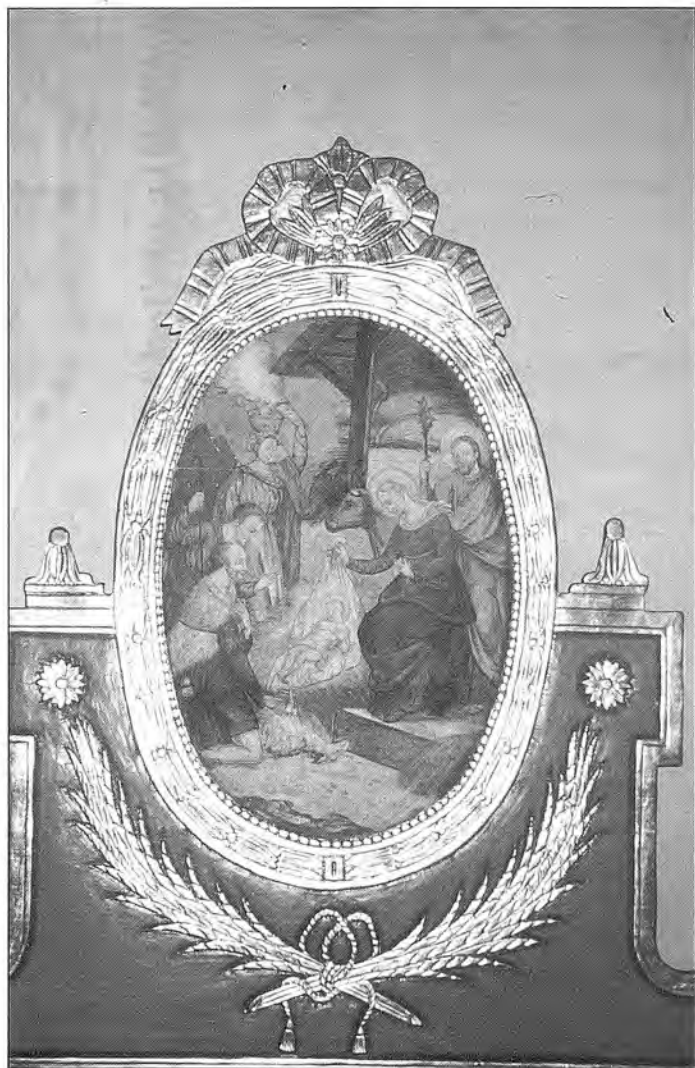
Detall amb la imatge de l'adoració dels pastors. Col·lecció Vayreda.