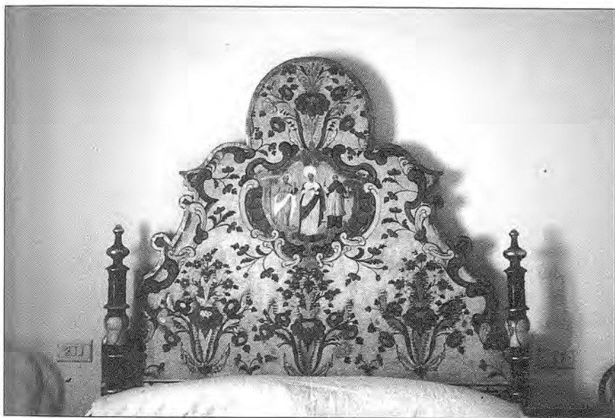
Llit policromat català de la primera meitat del segle XVIII. Col·lecció Olivé.