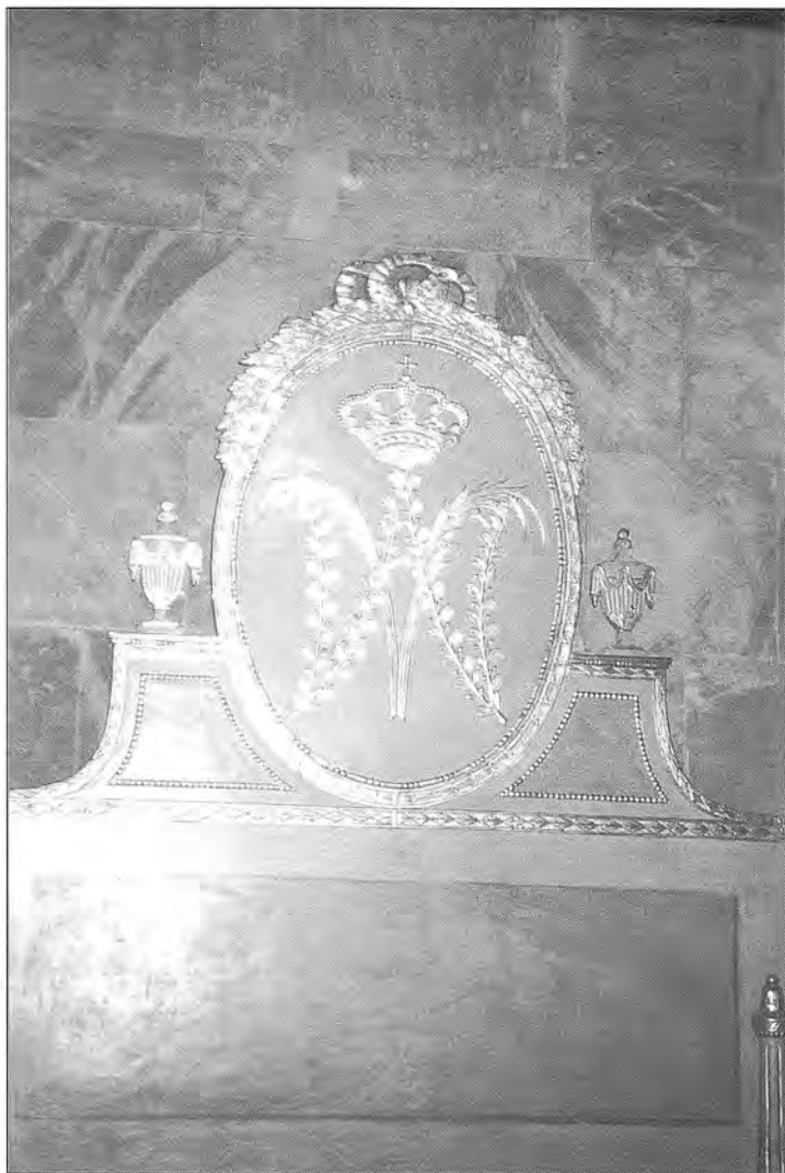
Capçal de la tipologia d'Olot. Col·lecció Trinchera. Museu Comarcal de la Garrotxa.