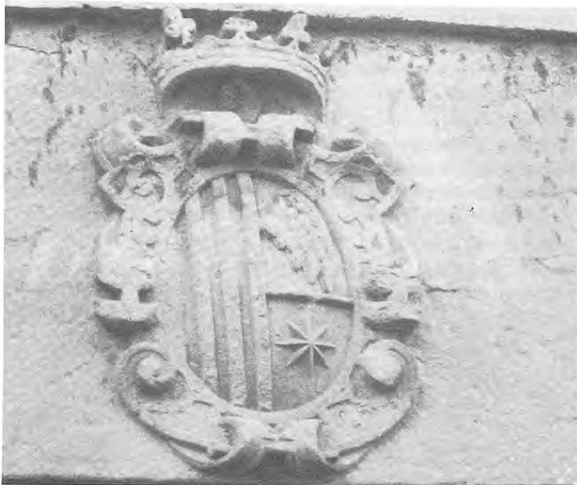
Gravat N.º 2

de les particions de llurs respectius escuts, al costat de la representació gràfica del seu cognom (17) . Les podríem denominar armes de situació (referència de lloc). No cal dir que la corona que timbra el citat blasó de la façana de l'Hospital és la reial de la Corona d'Aragó.