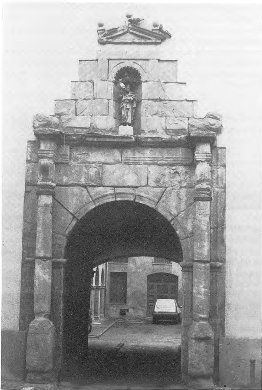
Gravat Nº. 1.