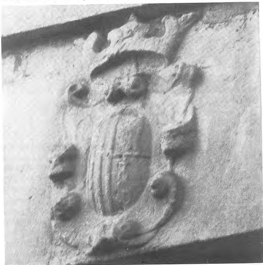
Gravat N.º 3

Mentrestant -i és de doldre- la progressiva degradació de la pedra acabarà de manera irreparable amb un interessant exemplar local renaixentista: la portalada de l'Hospital.