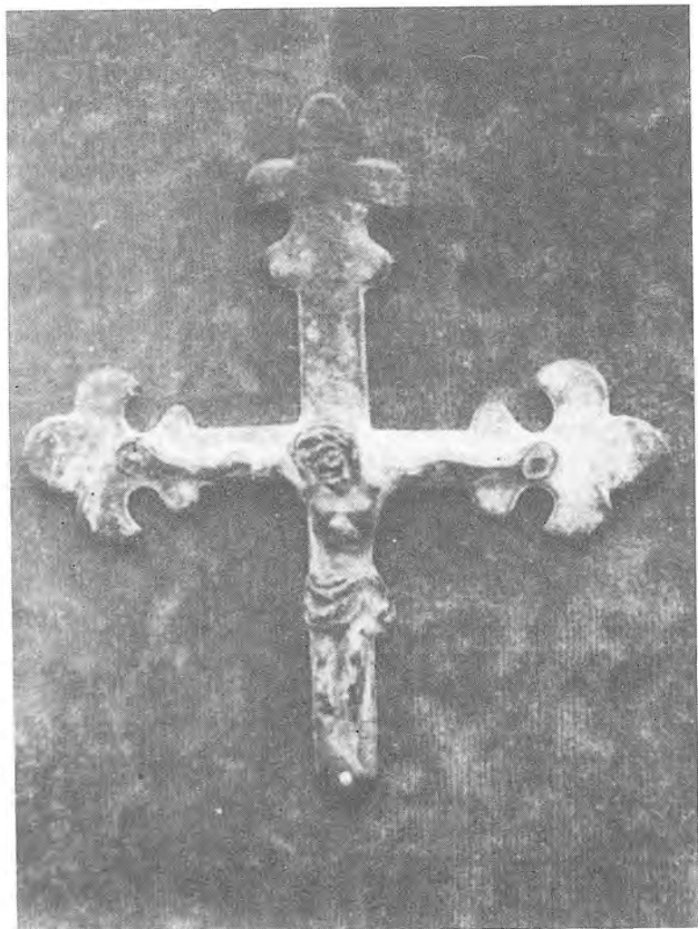
Crist tipus Llemotges quart de la col·lecció Coromina del Castell de Porqueres (Banyoles)