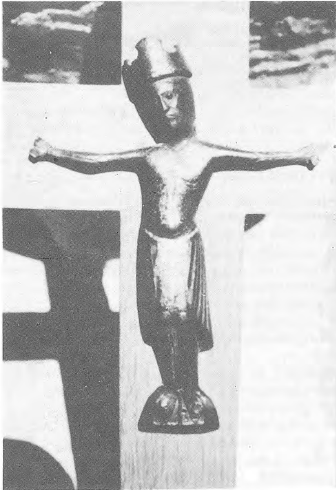
Crist tipus Llemotges segon, procedent de Centenys (Museu Arqueològic de Banyoles)