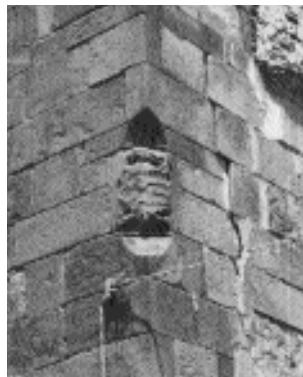
De l'any 1965 tenim aquesta imatge amb el detall de l'escut dels Tristany, a la cantonada de cal Nuix