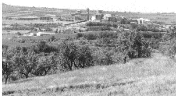
Panoràmica del nucli d'Ivorra en una imatge recent, vista des de la partida de les Escomes, al nord de la població; amb la torre i l'església en lloc destacat

La primera notícia documental en què apareix el nom d'Ivorra data del 1031 en una escriptura de venda i durant tot el segle XI i posteriors són molts els documents que en parlen, tots ells relacionats amb els comtes d'Urgell (veure l'entrada Torre del Castell d'Ivorra, dins d'arquitectura civil). Aquests documents parlen d'Ivorra com d'un castell o una vila fortificada. De fet, els vestigis que en queden així ho testimonien. Tot i que les esglésies, tant la parroquial de Sant Cugat com les de Santa Maria i de Sants Gervasi i Protasi, foren donades a la canònica de Solsona en 1076, els comtes d'Urgell van tenir el domini eminent del terme, que es va perllongar fins