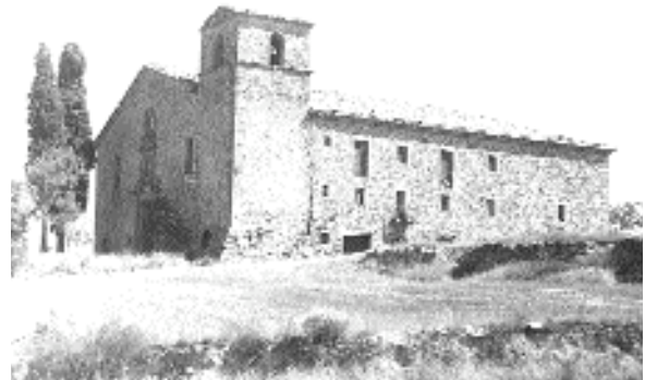
El santuari de Santa Maria abans de la seva restauració. L'obra, que substituïa la primitiva església romànica, ha esdevingut i esdevé un dels símbols més evidents d'Ivorra, que recorda el miracle eucarístic conegut popularment com el "Sant Dubte"