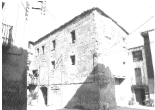
De l'any 1983 és, també, aquesta imatge que mostra la façana llevant i migjorn de cal Nuix (abans cal Carlà o Tristany), obra arquitectònica dels segles moderns

antic, mentre que el de cal Millàs, que trobem uns metres més avançat en relació a l'anterior, s'hauria bastit en època posterior, baixmedieval o fins i tot moderna, probablement coincidint amb la construcció de les cases adjacents, com cal Millàs, que ja es troben fora murs i que utilitzen la muralla com a mur de tancament posterior.