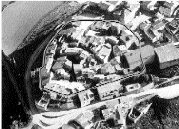
En aquesta imatge aèria de 1990 hom planteja el traçat de les muralles del nucli medieval presidit per la l'anomenada "Torre del Moro" en la part més alta de la vila

seguint el traçat urbà marcat pels actuals carrer Sota Eixides, plaça Major i travessera de les Eres. De la muralla se'n conserven algunes restes a la cara nord, on hom pot documentar, a part dels murs, una possible bestorre i també per la cara oest, damunt del pati de cal Millàs. Per tot el recorregut del carrer Sota Eixides, la muralla l'hem de situar, tanmateix, darrere dels coberts, on s'aixequen precisament les cases. El nucli medieval emmurallat s'obria en tres punts; un amb sortida per l'actual carrer del Forn, en la confluència amb la travessera de les Eres; l'altre amb sortida a la part baixa del carrer Major i finalment un altre, bastit a tocar de la primitiva església, actualment plaça Major. D'aquestes tres sortides, la del carrer Major encara conserva els portals, però tanmateix ens hem de remetre al primitiu traçat urbà per considerar el portal de cal Reart com el més