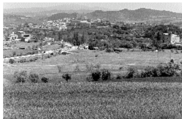
Panoràmica actual (abril de 2001) d'Ivorra des de ponent, amb el santuari, cal Closa i cal Sangrà en primer terme i el nucli encimbellat al fons

Francisco de Zamora, en el seu viatge a Catalunya, el 29 d'octubre del 1788 passa per Ivorra "que está situado en una eminencia y así sus calles son muy malas. La iglesia, que la ha hecho Pons, es buena y mejor su portada. La ha costeado Don Miguel de Tristany, natural de esta villa, y también han dejado una especie de fundación para la comunidad y la enseñanza. Tiene aquí una buena casa". Respecte als mitjans de vida afirma que "se coge trigo, aceite y mucho vino. Hay una torre circular muy antiquísima, situada en lo más alto". Acaba la seva descripció dient que "tiene unos 100 vecinos. Es el único pueblo que vimos en decadencia. Lo más singular de él son el Sant Ducte (sic) y la lápida que llevamos copiada". La descripció que fa Madoz del nucli d'Ivorra a començament del segle XIX és així: "se halla sit. parte en la pendiente occidental de un cerro, y parte en la cumbre de él, dominada de los vientos S. y O. con clima templado en verano y bastante frío en invierno, pero sano. Se compone la pobl. de 59 casas inclu-