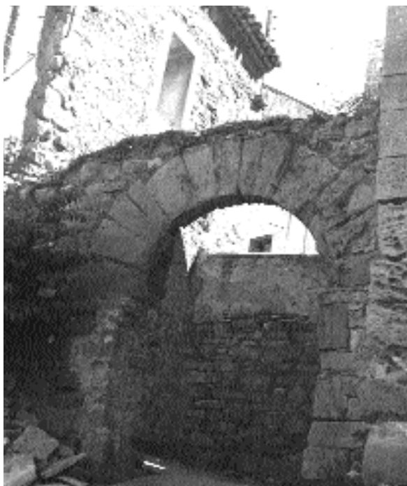
A partir del castell o torre els nuclis medievals nasqueren rere muralles formant viles closes, només obertes pels portals que hi donaven accés

seguint el traçat urbà marcat pels actuals carrer Sota Eixides, plaça Major i travessera de les Eres. De la muralla se'n conserven algunes restes a la cara nord, on hom pot documentar, a part dels murs, una possible bestorre i també per la cara oest, damunt del pati de cal Millàs. Per tot el recorregut del carrer Sota Eixides, la muralla l'hem de situar, tanmateix, darrere dels coberts, on s'aixequen precisament les cases. El nucli medieval emmurallat s'obria en tres punts; un amb sortida per l'actual carrer del Forn, en la confluència amb la travessera de les Eres; l'altre amb sortida a la part baixa del carrer Major i finalment un altre, bastit a tocar de la primitiva església, actualment plaça Major. D'aquestes tres sortides, la del carrer Major encara conserva els portals, però tanmateix ens hem de remetre al primitiu traçat urbà per considerar el portal de cal Reart com el més