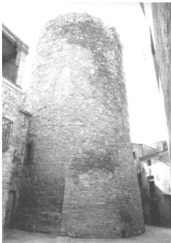
Com succeeix en bona part de la Catalunya Nova, Ivorra esdevé un d'aquells nuclis castrals que es desenvoluparen a redós d'una torre o castell primerencs

La documentació medieval, que ens parla en plural de les Ivorres, ens obre el camí a considerar la possibilitat d'un segon nucli, no pas agrupat, que s'hauria configurat en les immediacions del santuari i de l'era del Vicenç, on antigament hi havia l'església de Santa Maria i la capella dels sants Gervasi i Protasi. És molt probable, en aquest sentit, després de la campanya d'excavació de l'any 1997, que una prospecció més a fons de la zona donés ple sentit a la hipòtesi d'aquest segon nucli, coincident en el temps amb els orígens del nucli urbà pròpiament dit. Referint-nos a aquest, el seu origen l'hem de situar en època altmedieval, en el context de la reconques-