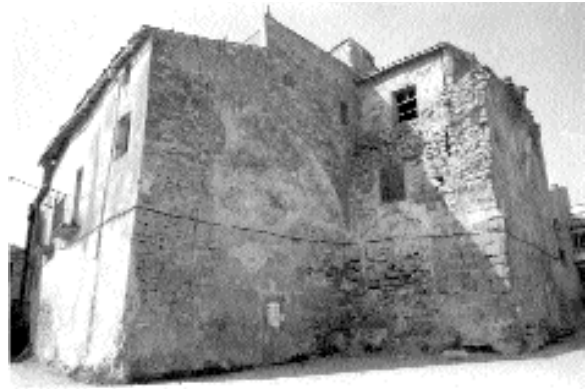
De l'any 1983 és també aquesta imatge de l'antiga rectoria amb les restes dels murs de la primitiva església romànica de Sant Cugat, consagrada el 1055 i donada a la canònica de Solsona al 1076

Com a anècdota curiosa de la història d'Ivorra, cal esmentar el fill natural que el rei Ferran II, el Catòlic, va tenir amb la dama catalana Aldonça d'Ivorra. Es tracta d'Alfons d'Aragó (1470-1520), que va ser Arquebisbe de Saragossa i és anomenat pel rei Ferran II com a "nuestro muy caro e muy amado fijo". Des d'aquest càrrec va ser l'alter ego del rei exercint com