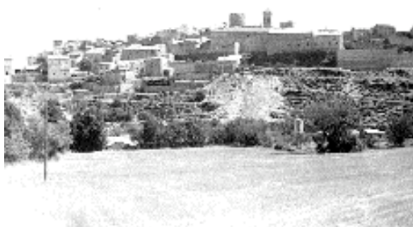
La màxima expansió del nucli arrenca al s. XVIII però es fa efectiva durant el segle XIX i primera meitat del XX. Aquesta imatge de l'any 1983 ens mostra el nucli encimbellat dalt del puig, amb la part medieval, que es desenvolupà pel vessant oest, i la part més moderna, que es desenvolupà fora murs, també pel vessant oest i al llarg de la carena vers migjorn

es basteix, a llevant del nucli, el nou temple parroquial i l'actual cal Salvadoret (o Rull). Finalment, i fora murs, també hem de ressenyar la construcció ja des del segle XVIII d'alguns habitatges exempts prop del santuari, com cal Segués, Paredador, Puig Satorra, Farran i Sangrà. O com cal Molins, que també formaria part, junt a diverses masoveries que es reparteixen per tot el terme, d'aquestes construccions d'època contemporània. Així mateix, dins el terme, s'entrecruaven camins importants, provinents de Calaf, Castellfollit de Riubregós, Torà, Guissona i Cervera; aquest fet, relacionat amb l'augment del trànsit de traginers a partir del segle XVIII, va fer que s'aixequessin dos hostals, a migjorn del nucli, en un lloc preminent conegut com els Hostalets.