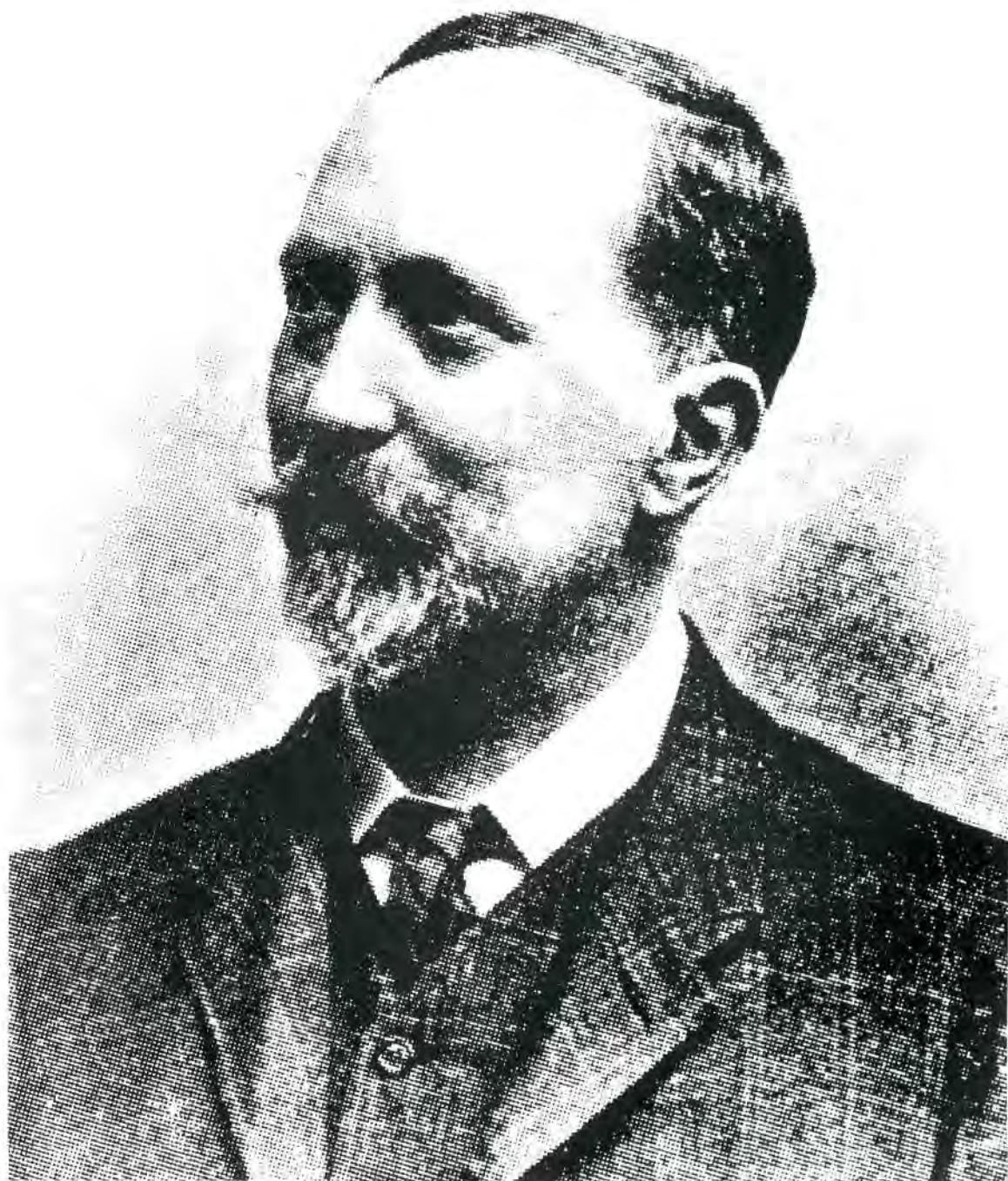
Josep Pella i Forgas.

s'integren dins del caliu cultural que sorgí amb el naixent catalanisme.