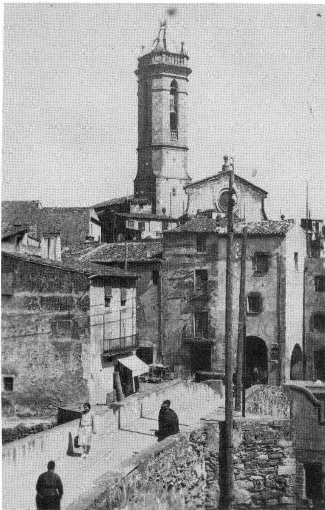
La Bisbal. Pont Vell.