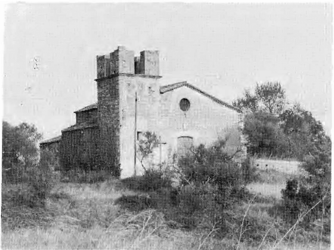
«Església nova» de Fenals d'Aro, amb construcció doble: una del segle XVI i l'altra del XVIII.

Constans concreta més dient que aquesta església «fou començada en 1764 i allargada deu anys després» (13). Finalment Joan Badia diu que aquesta església «és una construcció del segle XVIII» (14). Respecto l'opinió d'aquests autors, però no la puc compartir. Crec que tots ells s'han deixat enlluernar per les dates 1764 i 1774 que hi ha a la porta de la sagristia i a la façana respectivament. Però una observació atenta de l'edifici demostra clarament, al meu entendre, dues etapes de construcció. Això pot veure's mirant l'edifici, a l'exterior, del costat de migdia. Hi ha un tram d'edifici que comprèn l'absis i les dues primeres capelles laterals, contigües a l'absis, una a cada costat, que degué ésser aixecat en el segle XVI, en tot cas no gaire abans. Avui això també es confirma per haver-se tret l'enguixat interior de l'església fins a ran de volta. No hi fa res que l'absis sigui de semicercle, és evident que no es tracta d'una construcció romànica, però aquest primer tram, que devia tenir la seva façana, estava ja aixecat l'any 1585, data del plànol que publiquem. De totes maneres es tracta d'una construcció de caire molt popular.