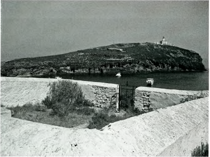
Cementiri de les Columbretes amb el far al fons

llargues estones cultivant la Cultura. Poc abans d'acomiar-me en aquella primera trobada va tenir la gentilesa d'ensenyar-me aquest seu món que realment em va deixar sorprès: aquell pis farcit de vitrines amb minerals, invertebrats, ceràmiques de totes les èpoques, i lleixes plenes de llibres, fitxers de postals, i armaris amb fullets, cartells, etc.; era realment el mirall de les inquietuds de la seva vida. Redactant aquestes línies em vénen al cap alguns dels seus darrers comentaris l'últim dia que ens vam veure, sobre les incògnites que del passat medieval de la ciutat presentaven les recents troballes arqueològiques realitzades l'estiu tardor de 2010 a tocar de casa seva, just al davant de l'antic monestir benedictí.