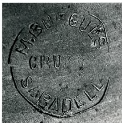
Fig. 19 i 20. Portatestos i segell.