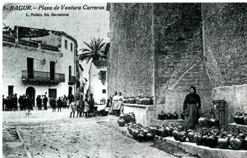
Fig. 6. Parada de terrissa a la plaça de Ventura Carreras (actual Plaça de la Vila) de Begur. Principis segle XX.

preparació, els colors amb què treballa i la seva composició ( ACBE. Hemeroteca: L'Avenç del Empordà, 15/08/1907 ).