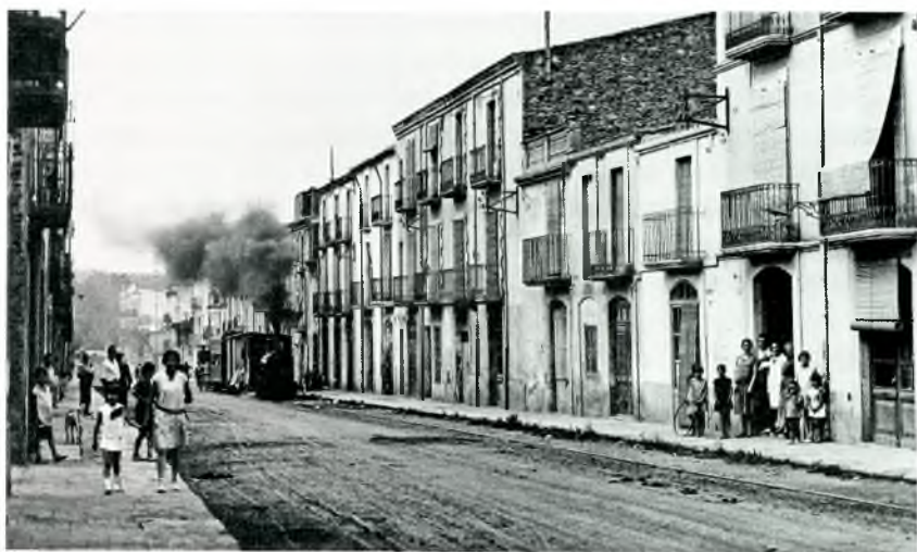
10. - LA BISBAL. - CALLE SIS DE OCTUBRE.

Fig. 4. Imatge del carrer del Sis d'Octubre de 1869 pels voltants de l'any 1920.