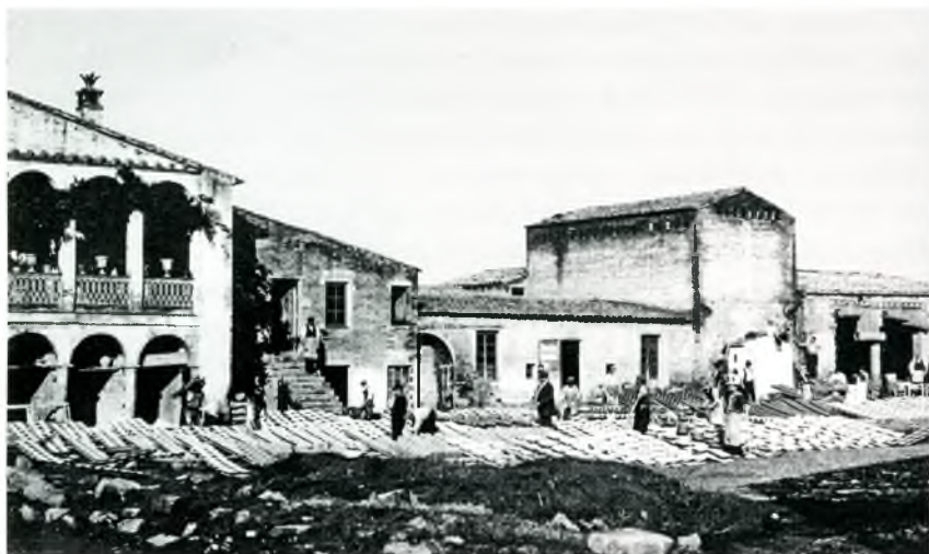
Fig. 9. Vista exterior de l'edifici de la fàbrica de terrissa Unión Obrera de Alfareros al carrer del Carme. Ca. 1914.

L'article critica les solucions donades per tal de minimitzar la crisi, especialment aquelles que suposen baixar els preus dels productes manufacturats i sobretot la retallada de salaris, que tan greus conseqüències comporta, a la pròpia indústria: "(...) es pobre recurs donar sortida als géneros a baix preu, abaixant la má d'obra, fins a un punt en que quant tot en la vida s'encareix y els temps obliguen a fer dispendis en objectes que trenta anys endarrera hagueren considerat supérfluos y avuy formen part d'una necessitat després de la del nodriment no cal el petit salari al obrer. El recurs d'abaixar la má d'obra es el dels ignoscents que maten la meiteixa industria que'ls ha de donar vida. Y aixó fa que'ls desperts, els aptes pera assimilarse a un'altre industria deixen un ofici que escassament dona pera mal nodrirse y no's posin aprenents joves pera continuarlo". El resultat inevitable d'aquest cercle viciós ha estat, segons Burguès, que "(...) la carn esplotable ha canviat d'industria, obligada per les necessitats de la vida y no tenir un clar concepte dels recursos qu'ofereix una industria com la terrissera" ( ACBE. Hemeroteca: L'Avenç del Empordá , 15/08/1907).