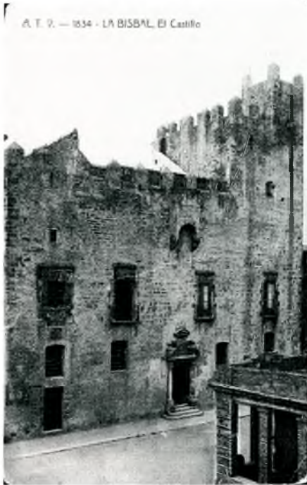
Fig. 11. El castell. Ca. 1908. Alçat pels bisbes de Girona, senyors de la Bisbal, els darrers dos-cents anys ha fet funcions ben diverses: fort, caserna, seu de l'Administració de justícia, presó i arxiu notarial del districte judicial.