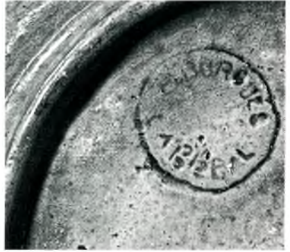
Fig. 23 i 24. Plata i segell.