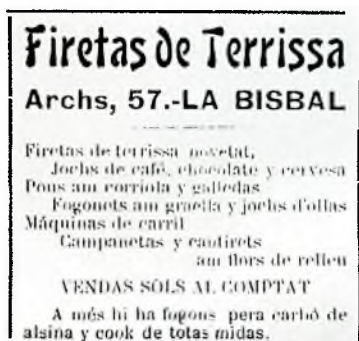
Fig. 5. Anunci publicitari “Firetas de Terrissa”, inserit en el periòdic L'Escut Emporità del dia 15/08/1906.