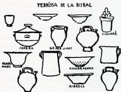
Fig. 17. Tipologia de la terrissa bisbalenca, publicada en el llibre Estudis de terrissa catalana . Edició facsímil de la publicació original (Ajuntament de Sabadell, 1982).

vernís es limitava a algunes parts dels atuells en el cas d'obra de botxa (càntirs, poals, olles, orinals) en canvi per acolorir l'obra de pisa (plats, plates, gibrells, bols) s'utilitzaven les engalbes locals (vermelles i blanques) (fig. 17).