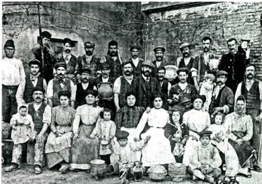
Fig. 10. Imatge de família dels treballadors de la Unión Obrera a principis segle XX.

preta de les paraules de Burguès que el que calia era crear una “cooperativa de producció de ceràmica artística”, per a arribar a aconseguir la necessària connexió entre tècnics, artistes i terrissers en una producció conjunta ( ACBE. Hemeroteca: L'Avenç del Empordà, 11/04/1908 ). Marian, en canvi, veu impossible aquesta cooperació “(...) Ni amb els amos ni amb els obrers he trobat ressó (...) proposant a tots els que volen escoltar-me la fundació d'una nova Cooperació”, i insisteix en la creació d'una Escola de Ceràmica entesa des d'un punt de vista més ampli, incorporant totes les branques de la producció. ( ACBE. Hemeroteca: L'Avenç del Empordà, 18/04/1908 ).