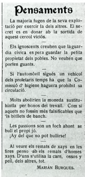
Fig. 8. “Pensaments” de Marià Burguès publicats en el setmanari L'Avenç del Empordà del dia 06/07/1907.

la seva particular visió de la reacció: “(...) tornar enrera l’avenç assolit (...), treballar per els beneficis d’una secta, partit, camarilla, etc. (...), la reacció es destrucció”. ( ACBE. Hemeroteca: L’Avenç del Empordà, 01/06/1907 ).