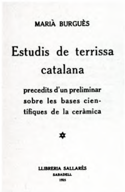
Fig. 3. Portada del llibre Estudis de terrissa catalana precedits d'un estudi preliminar sobre les bases científiques de la ceràmica . Edició fac-simil de la publicació original (Ajuntament de Sabadell, 1982). Biblioteca Terracotta Museu