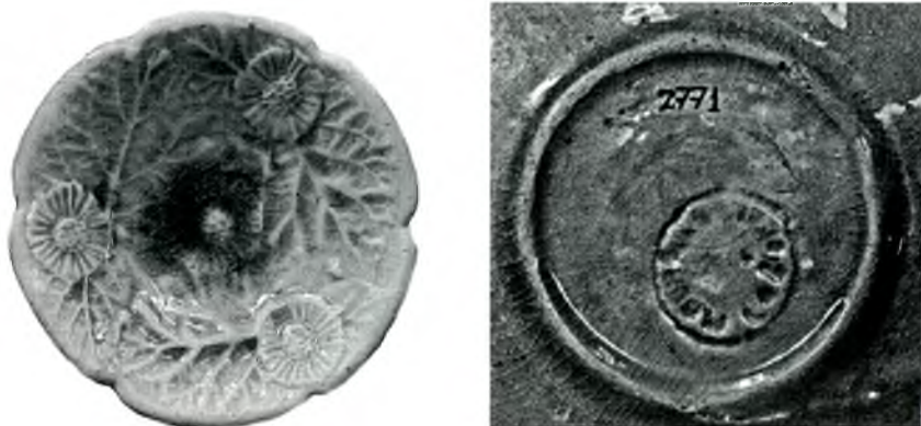
Fig. 21 i 22. Cendrer i segell.

al centre. Al revers, segell M. BURGUÈS. LA BISBAL