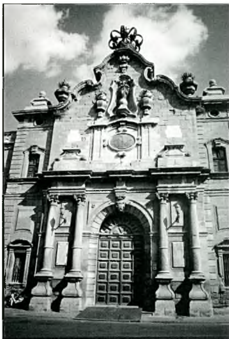
Foto núm. 9: A l'antiga Universitat de Cervera el 3 de febrer de 2006 es celebrà una assemblea amb el lema: "La terra, un bé a protegir".

es, i el medi natural, i reconduir aquesta atracció del món urbà cap al món rural 46 .