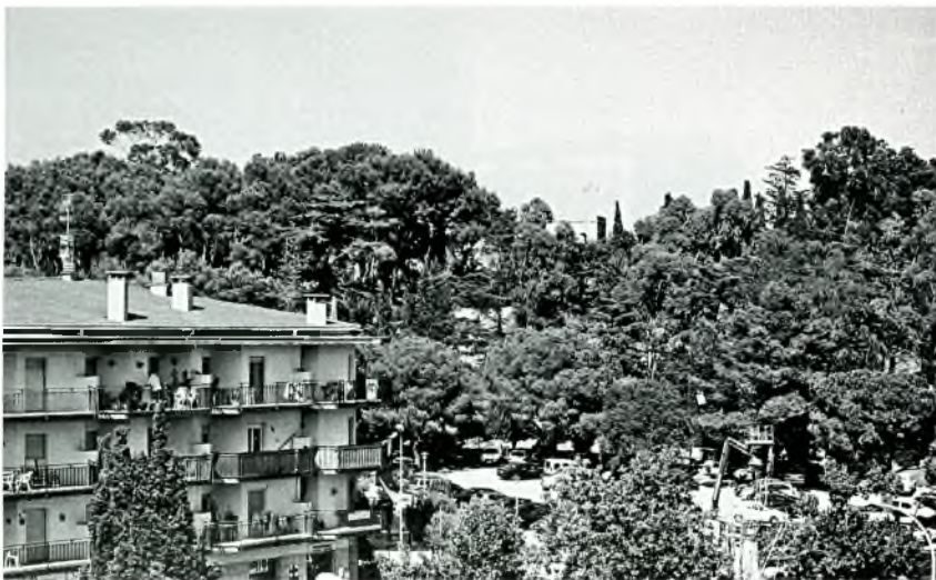
Foto núm. 8: El collet de Sant Antoni intentant sobreviure arran de mar.