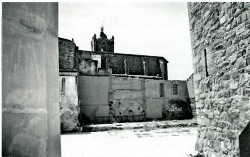
Foto núm. 3: Església parroquial de Sant Martí de Calonge vista des de la Torre Quadrada. Entre les dues hi ha una distància d'uns 50 m, equivalents als 30 passos eclesiàstics de la cellera que envoltava l'església a l'edat mitjana.

en una cellera, el van tenir altres poblacions de les Gavarres 11 , i conserva encara aquest nom la Celler de Ter (la Selva).