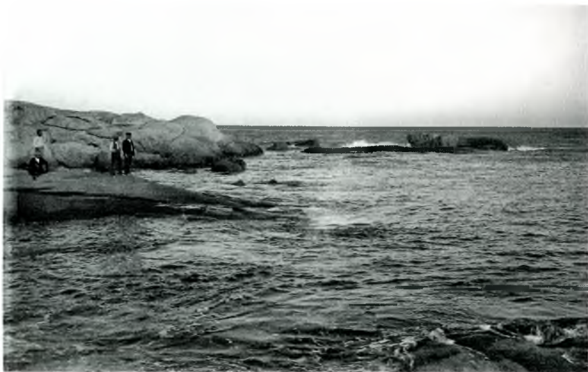
Foto núm. 2: Roques Planes cap al 1900. Reculant a la baixa edat mitjana, Trochmal era una possessió de la Pabordia de Juliol de la Catedral de Girona.

a) L'any 1314, un alou situat a Calonge, pertanyia un 50% al noble Berenguer de Cruïlles, i l'altre 50% al rector de l'altar de Sant Benet, fundada a la catedral de Girona, si bé les rendes, les percebia Berenguer de Cruïlles.