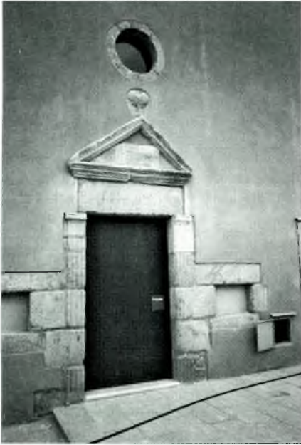
Foto núm. 6: L'Antic Hospital de Calonge ha sigut rehabilitat per a biblioteca i arxiu històric municipal, amb la funció d'investigar i difondre la història local. A l'edat mitjana el paratge fou El camp de ça Sala , amb 30 horts, on es salava el peix i la carn.

Encara que se'n conserven diversos de Calonge i alguns inventariats, que nosaltres sabem l'únic fons patrimonial que ha sigut extractat i publicat és el de la família Bou 34 , des del segle XIV fins principis del segle XX propietària del mas Bou de Fonts (Calonge). A mitjan segle XX, fou adquirit per la família vinguda del mas Palà (Castelladral), que tenia extractat i publicat el seu fons patrimonial 35 .