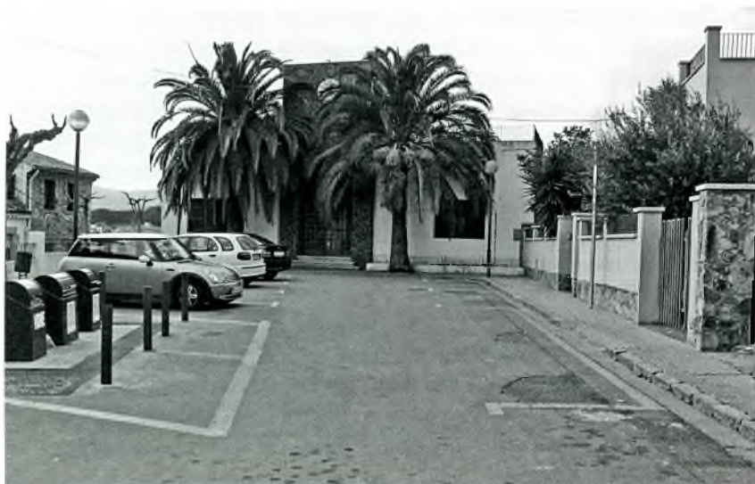
Foto núm. 4: Plaça de la Doma de Calonge, que a l'edat mitjana fou cementiri, on 39 remences es reuniren el 1448.

en tot el país, sinó que de vegades el rei convocava a Corts per reunir-les en cada qüestió en una ciutat diferent, i agafaven representació dels tres estaments del país, nobles, eclesiàstics (ambdós amb dominis feudals), i síndics de ciutats i viles amb jurisdicció reial i que gaudien del privilegi d'acudir a les Corts, com Calonge des de 1437.