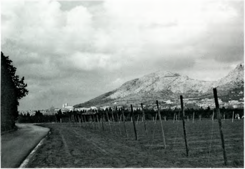
Foto núm. 10: Torroella de Montgrí. Terres del ric Baix Ter i al fons l'església de Torroella de Montgrí. A la baixa edat mitjana fou vila reial i un seu sindic es reunia amb els de Pals i de Calonge a les Corts de Barcelona el 2 de gener de 1456.