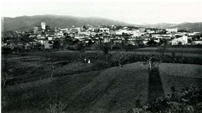
Foto núm. 1: Paisatge rural i urbà de Calonge de cap al 1900.