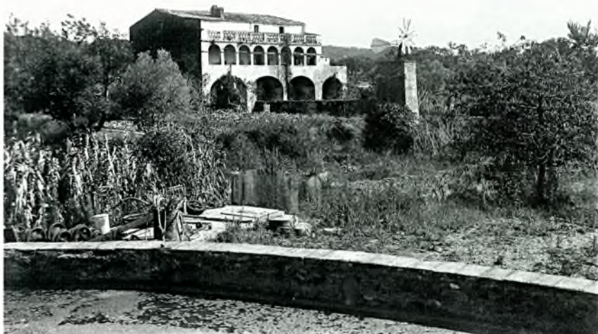
Foto núm. 7: El mas Bou de Fonts cap al 1900, quan encara era dels descendents de la família Vidal àlies Bou del segle XIV.

més complexa i té com a objectiu primordial aconseguir una comprensió global d'aquell territori i els seus problemes 36 .