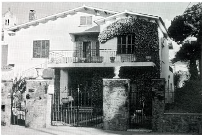
Fig. 9. Casa d'Agustí Cortés (avinguda Sant Jordi).

El berenar, a les 5 de la tarda, era senzill: pa de llesca amb sal, oli i llonganissa, o bé pa sucat amb vi i ensucrat, o torrada amb una mica d'arengada o bescuits de forner amb xocolata.