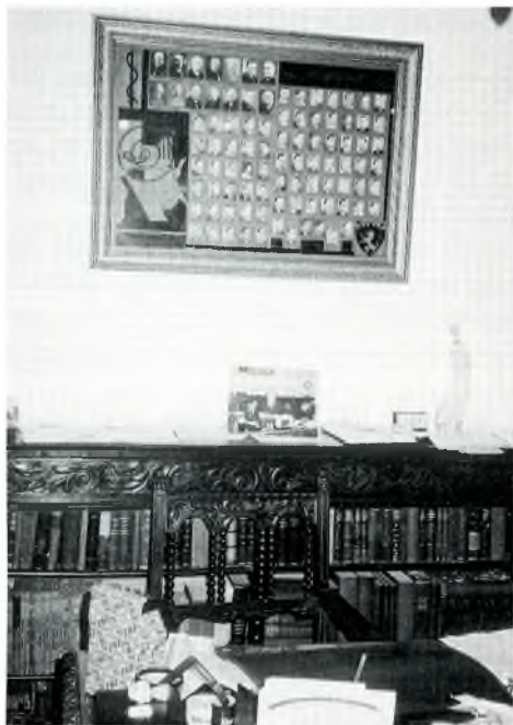
Fig. 8. Consultori de Joan Turró (carrer de la Rutlla).