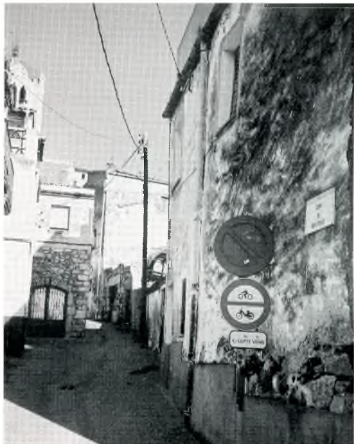
Fig. 2. Carrer de Genís Ponjoan

Tornant a la realitat, aquesta curiosa tendència és molt probable que tingui relació purament amb el desig d'ajudar el proïsme.