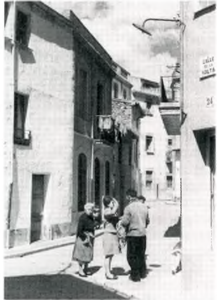
Fig. 2. Carrer de la Notaria, continuació del de les Voltes, en una imatge dels anys seixanta. A l'esquerra pot observar-se encara la casa que hi havia davant de can Conet, lloc on actualment hi ha un magatzem. Al fons el suposat edifici de la cúria i notaria.