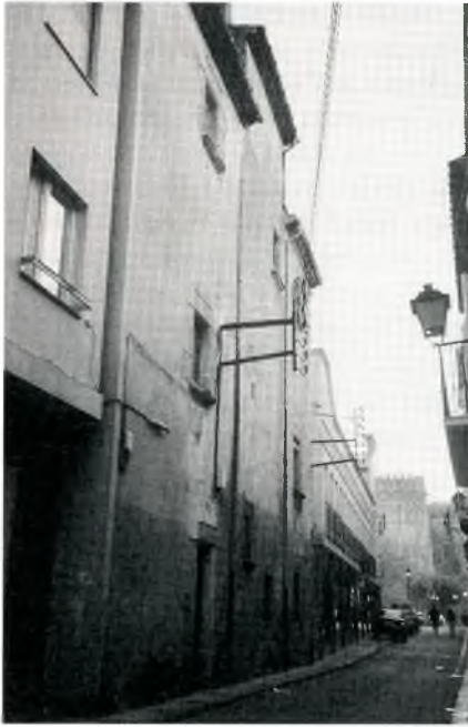
Fig. 4. La façana nord del que probablement devia ser l'edifici de la cúria i notaria dóna al carrer de l'Hospital. Al fons es pot veure la torre del Fum del conjunt monàstic.