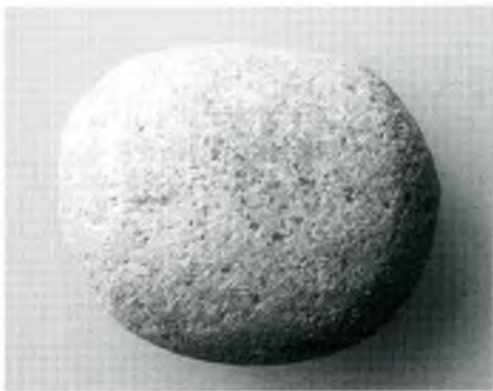
Fig. 7. Percutor bidistal de pòrfir granític.