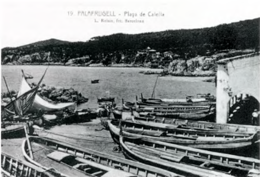
Arxiu Municipal de Palafrugell.

Com ja se'n ha fet esment, entre la documentació analitzada se'n troba d'altra en la qual apareixen mercaderies arribades per via marítima i reexpedides per via terrestre a altres poblacions.