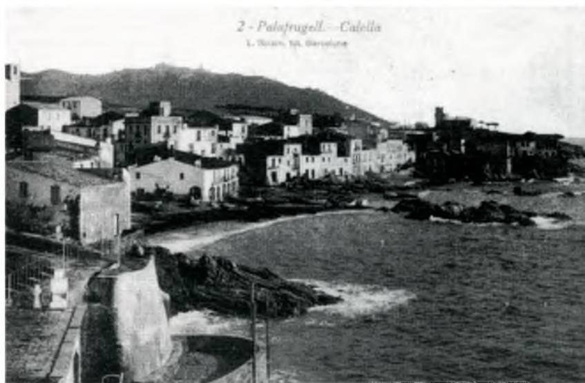
Arxiu Municipal de Palafrugell.

Queda encara per analitzar l'última de les relacions, la que es refereix a les arribades a Palafrugell.