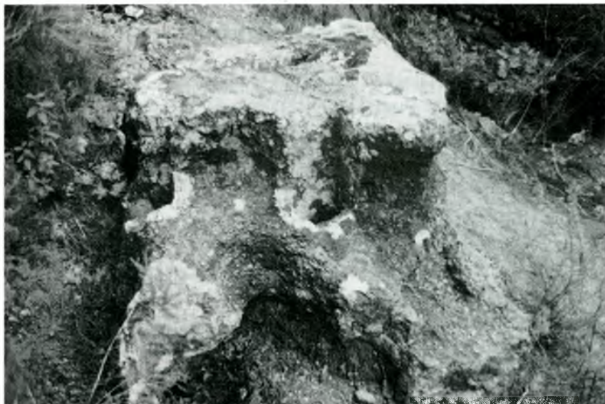
Fig 3. Fotografia de les restes del forn, vistes des del sud, en el seu estat actual. En primer terme s'observa l'engraellat, l'arrancament de la volta i el pilar central.