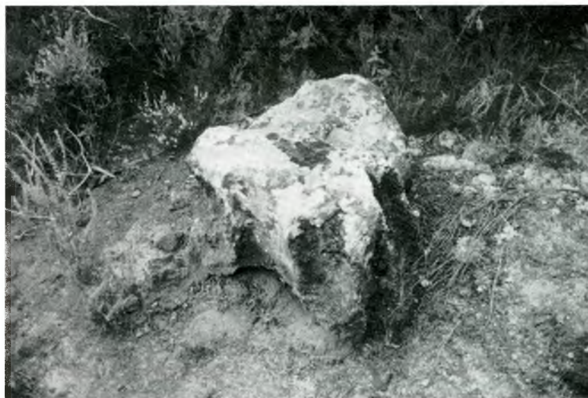
Fig 4. L'estructura vista des de l'est.