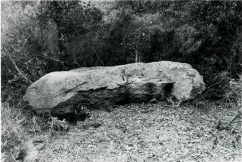
Fig 3. La Pedra Ramera, que amida 3,02 m de llargària, serví de fita entre Solius i Bell-lloc. Fotografia obtinguda el dia que el menhir va ser localitzat.

Amida 3,02 per 1,35 per 0,95 m totals. Per tant, es tracta d'un dels menhirs més grans de la comarca, bé que no sabem l'alçària total dels que encara resten plantats(fig. 3).