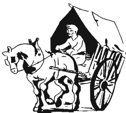
Carro de l'aiguader