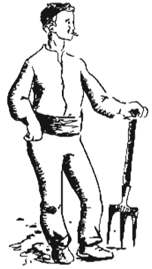
Mosso de casa de pagès