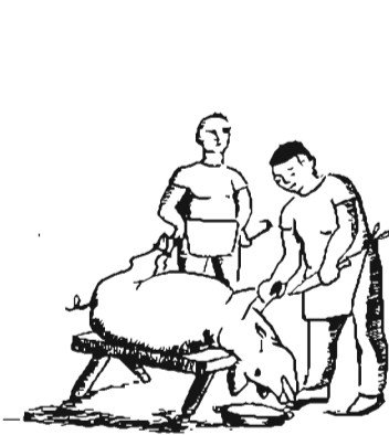
Matador de porcs