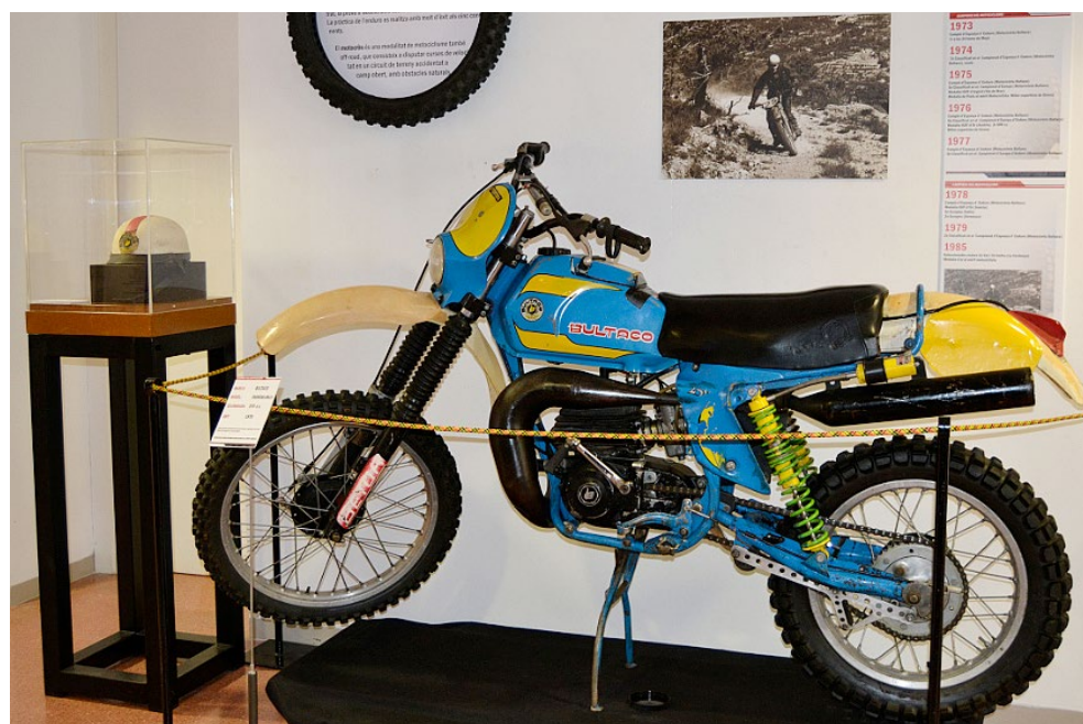
Motocicleta del campió Narcís Casas de la modalitat d'Enduro (1978). Marca Bultaco, model: Frontera MK11, 370 c.c. cedida al Museu per Narcís Casas, des del Museu de la Moto de Bassella.

Un altre factor important a aconseguir en aquest tipus de prenedes és la resistència. S'aconsegueix amb el teixit CORDURA®, patentat per DuPont l'any