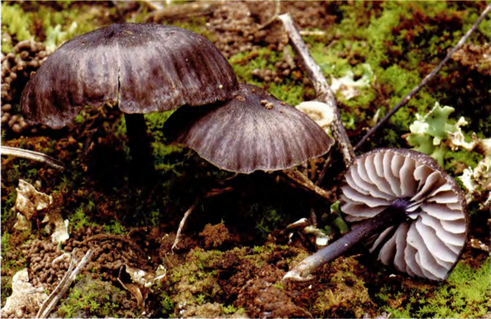
Entoloma cruentatum (Quél.) Noordel.