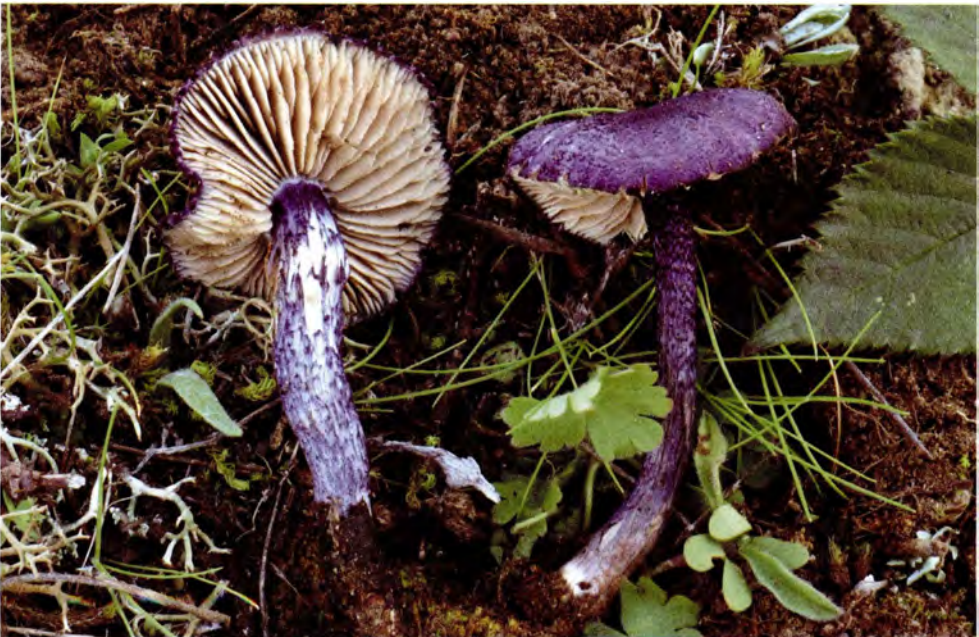
Entoloma cedretorum (Romagn. & Riousset) Noordel.