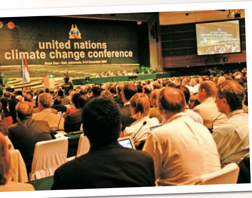
Conferència sobre el canvi climàtic de les Nacions Unides el 2007, a Bali (Indonèsia).