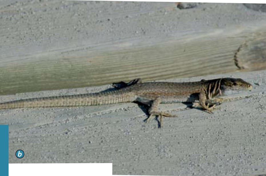
Figura 2. La variabilitat morfològica de la sargantana balear i pitiüsa és molt elevada a les distintes poblacions. a) Podarcis lilfordi , na Guardia (Mallorca); b) P. pityusensis , punta des Trucadors (Formentera); c) P. lilfordi , sa Dragonera (Mallorca), i d) P. pityusensis , la Mola (Formentera).

la possibilitat d'amplificar i seqüenciar el DNA i poder conèixer la variabilitat de les seqüències nucleotídiques. Aquestes tècniques han tingut un gran impacte en la sistemàtica en general i en particular en els rèptils, i ens han permès establir relacions filogenètiques consistents entre les espècies de Podarcis .