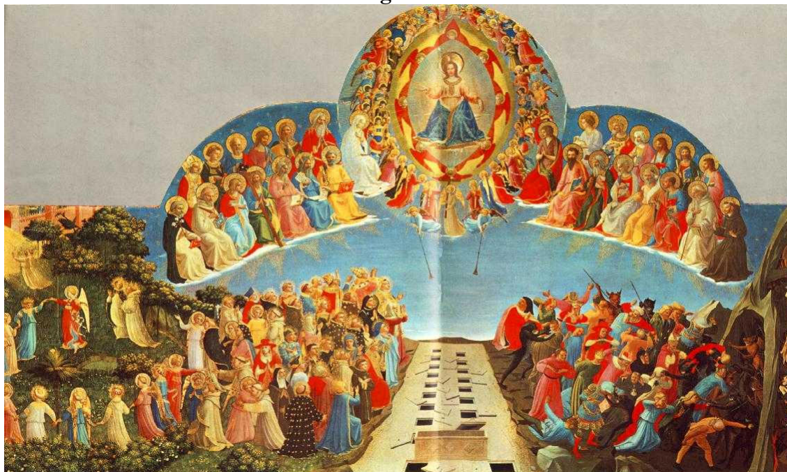
Fra Angelico. O Juízo Final. Detalhe do Inferno (1432-1435). Museo di San Marco, Florença.