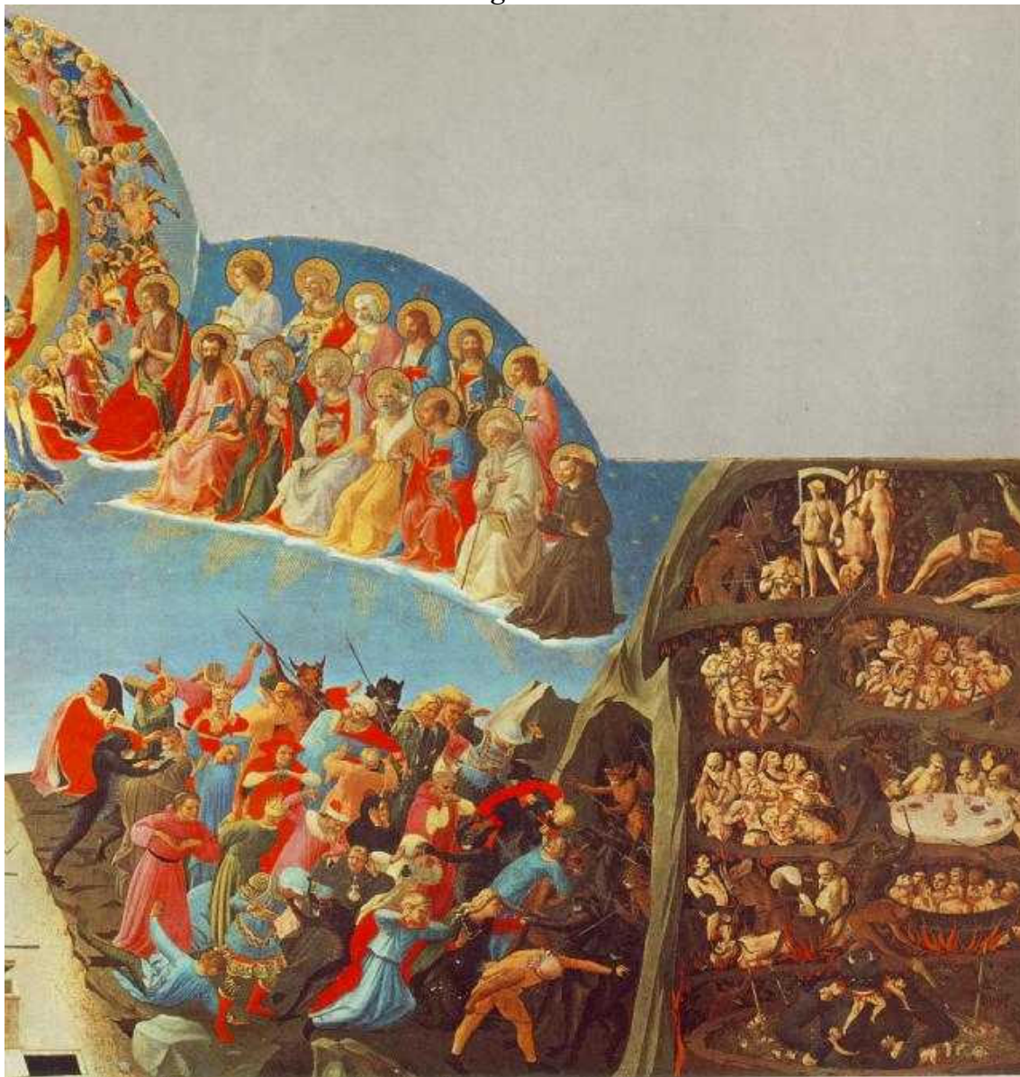
Fra Angélico. O Juízo Final. Detalhe do Inferno (c.1432-1435). Museo di San Marco, Florença.

As torturas do Inferno, de acordo com o pintor, estão divididas em cinco estágios: