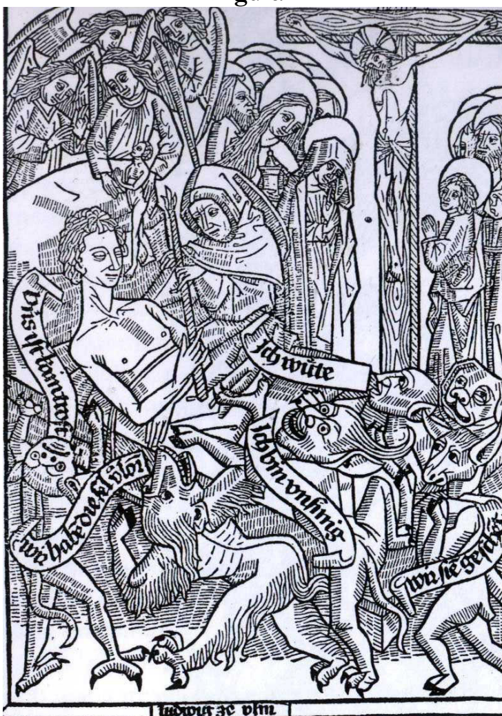
O homem em seu leito de morte (c. 1470). Ilustração do livro A Arte de Bem Morrer , publicada em Ulm.