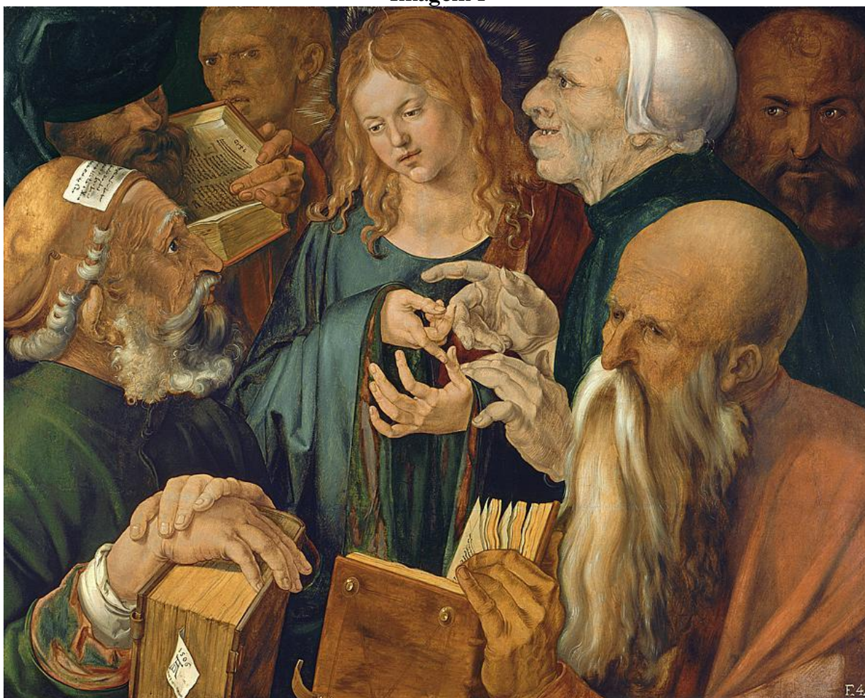
Cristo com os doutores (1506), de Albrecht Dürer (1471-1528). Óleo sobre painel, 65 x 80 cm, Museo Thyssen-Bornemisza, Madrid.