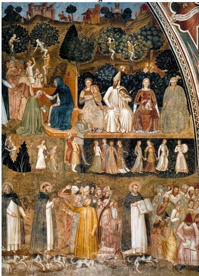
Detalhe da Via veritatis (ou Igreja Militante e Triunfante ), afresco de Andrea de Bonaiuto (1343-1377). Museo di Santa Maria Novella, Cappellone degli Spagnoli, Florença.