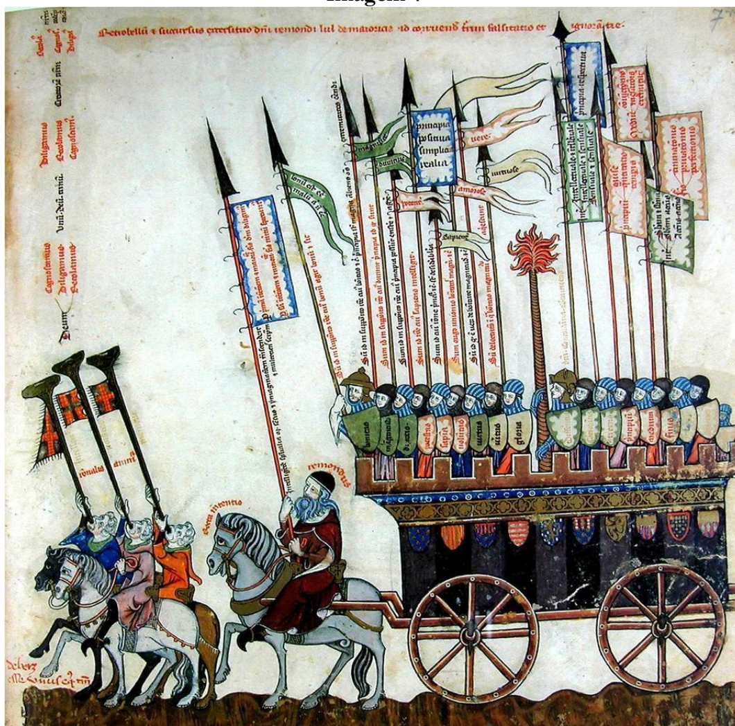
Iluminura VII do Breviculum (1325). Badische Landesbibliothek de Karlsruhe, Alemanha. Codex St. Peter, perg. 92.