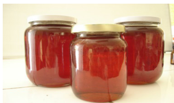
Figura 1. Miel hidrolizada

Para la miel hidrolizada, al no existir la cultura de producir este producto en las paneleras, se elaboraron cinco muestras con jugos clarificados con mucilagos. Cuatro muestras con jugos clarificados en factorías, donde es común el uso de químicos (hidrosulfito de sodio) para su posterior concentración hasta punto de miel y dos muestras de miel elaboradas por el mercado local, eventualmente producidas de forma artesanal. Para la miel hidrolizada de caña, se trata el jugo, se incorpora ácido, se concentra hasta valores similares de sólidos solubles a la miel de abejas y envasa, tal como se aprecia en la figura 1.