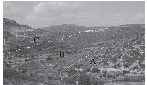
Figura 2 | Foto panoràmica del jaciment del Barranc de la Torre Folch. A) Formació Margues i calcàries de les Artoles. B) Fm. Argiles de Morella. C) Fm. Calcàries i margues de Xert.

Pel damunt es troben 78 metres d'una alternança de trams de lutites (rogenques i grises) amb alguna passada calcària i trams predominantment arenosos amb cossos de morfologia lenticular. Les arenen presenten estratificacions encruades planars i de solc, així com laminació planar. Sovint s'aprecien nivells de microconglomerats a la base dels canals i bioturbació al sostre. La granulometria és de fina a mitja. La part mitja i superior d'aquesta unitat presenta fragments carbonosos vegetals. S'observa també un canvi en la coloració dels cossos arenosos, grisencs a la part baixa i ocres cap als 2/3 superiors, denotant condicions d'ambient sedimentaris de menor profunditat de làmina d'aigua a la base de la formació. Aquesta unitat s'interpreta com una plana deltaica d'inundació amb influència mareal, (Salas,