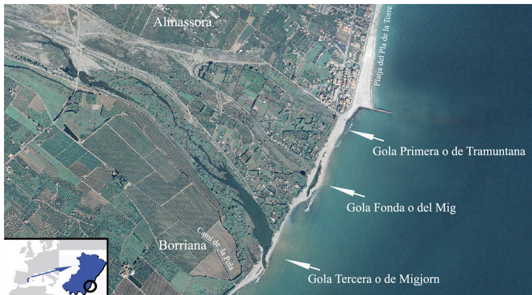
FIGURA 1. Localització de l'àrea d'estudi.

S'ha de remarcar, per altra banda, que els estudis malacològics del litoral castellanenc són molt escassos. Podem citar els recents treballs, sempre en àmbits taxonòmics molt específics, sobre els bivalves de la família pectinidae de Peña & Saavedra (2012) i els estudis sobre la predació dels gasteròpodes de la família naticidae sobre el bivalve Spisula subtruncata (Da Costa, 1778) de González et al. (2012). L'únic estudi publicat sobre la riquesa dels mol·luscs del litoral castellanenc mitjançant mostres de les tanatocenosis de les platges (Mundo & Forner, 2013) estava limitat a una part del litoral del Baix Maestrat. Un estudi general sobre la riquesa absoluta de mol·luscs de la zona no ha estat mai elaborat i sens dubte requeriria d'esforços molt considerables. El treball d'aquesta mena més pròxim, geogràficament i ecològicament, és el de Brunet & Capdevila (2005) sobre el Delta de l'Ebre, tot i que la singularitat d'aquest ecosistema, amb tot el ventall d'ambients que comporta, no és directament aplicable al litoral de la Plana. Aquesta mancança, per si sola, ja justifica aquest treball.