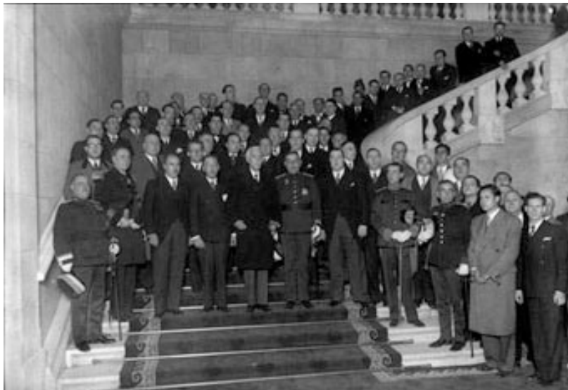
Sortida de la celebració de la sessió oficial d'obertura del Parlament de Catalunya amb assistència de Francesc Macià (1932)

No hi manquen, en aquest sistema de partits estatalistes, les formacions obreres: la Federació Catalana del PSOE i el Partit Comunista de Catalunya, secció catalana del Partido Comunista de España. Amb tot, la gran força proletària segueix essent la CNT, tot i que dividida en aquests anys entre el revolucionarisme anarquista de la FAI i el sindicalisme pragmàtic dels trentistes, organitzats des del 1933 en els Sindicats d'Oposició. Com a conseqüència d'aquest doble sistema de partits, el multipartidisme a la Catalunya republicana és extrem. I si, al Parlament català elegit el 1932, només hi estan representats sis o set grups, això s'explica tan sols per una llei electoral brutalment majoritària, que penalitzava molt els partits mitjans i petits.