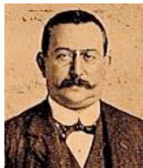
Enric Prat de la Riba