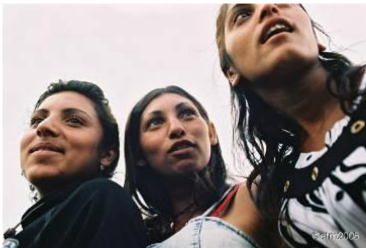
Noies d’ètnia gitana, en una trobada evangèlica

Le Cossec ha trobat un poble a qui alliberar de la seva pobresa i predicar-li l’Evangeli. Ha arribat el moment d’acomplir el seu anhel adolescent.