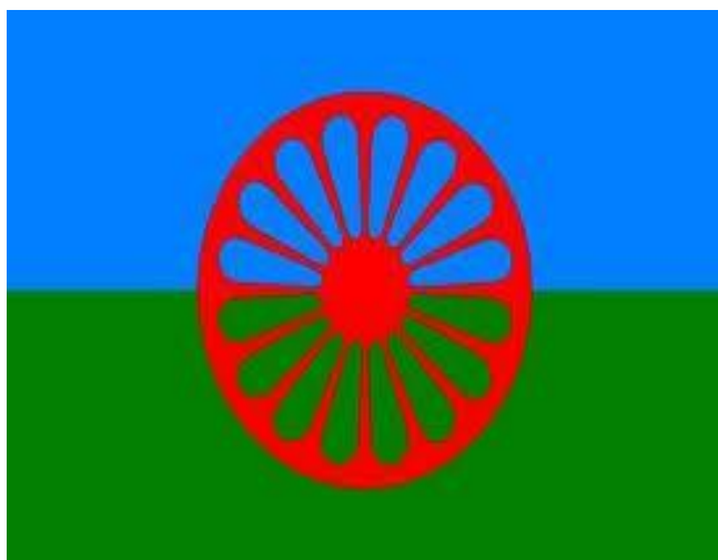
Bandera símbol del poble gitano

Els desvetllament religiós entre el poble gitano és un dels gran esdeveniments religiosos del segle XX. Comença a França al 1950 i s'estén per tot el món.