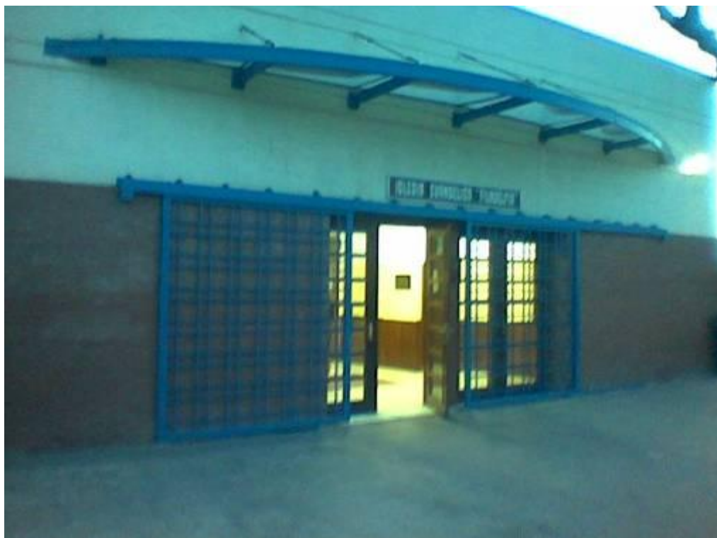
Ésglésia evangèlica de Filadèlfia al barri lleidatà de la Mariola, avui