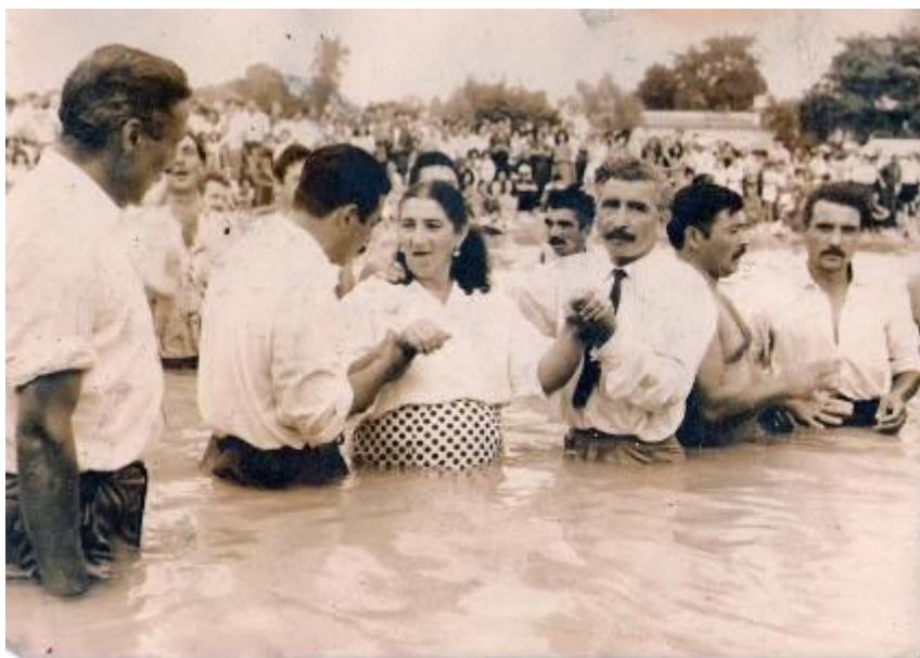
Baptisme evangèlic per immersió

Tchinine i Lokète volen tornar a Catalunya a predicar l'Evangelí i ho faran per primer cop un mes després del baptisme de Lokète, l'1 d'abril de 1965.