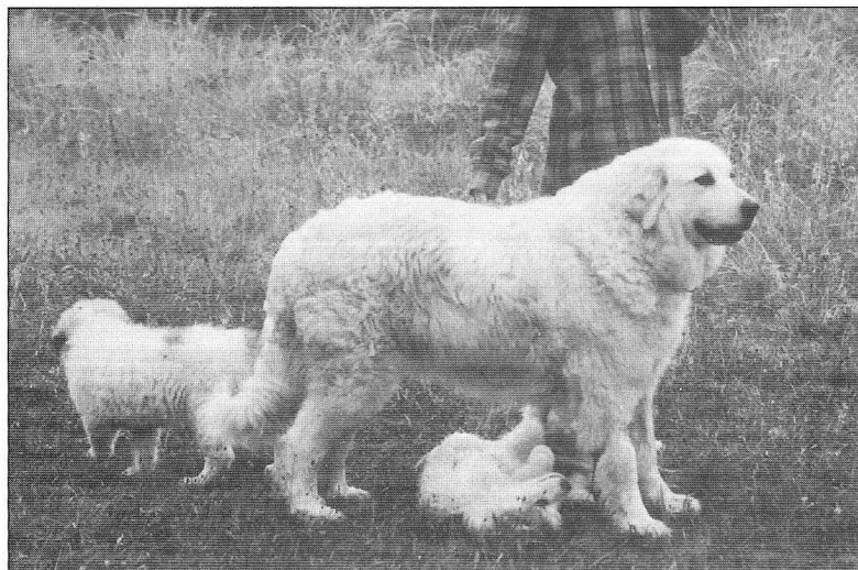
Un exemplar de gossa amb dues cries

Una activitat del nostre Collsacabra que per a molts pot haver passat per alt és la cria de gossos de raça: a la masia de Mierons, en el terme de Tavertet i a la zona del vessant del Ter entre el Villaret i Sobiranes, des de fa ja 15 anys una família es dedica a la cria del gos de Muntanya dels Pirineus. Aquest gos se'l coneix també com a Mastí, Gos Ramader, Chien de Berger, Berger Català, Patou, Gran Pirineu o tan sols Muntanya.