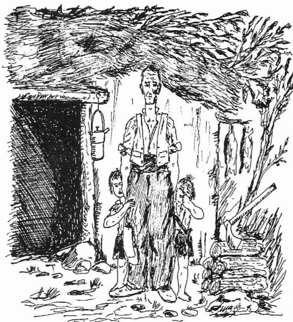
En Manta, amb la fillada Dibuix: Jordi Font